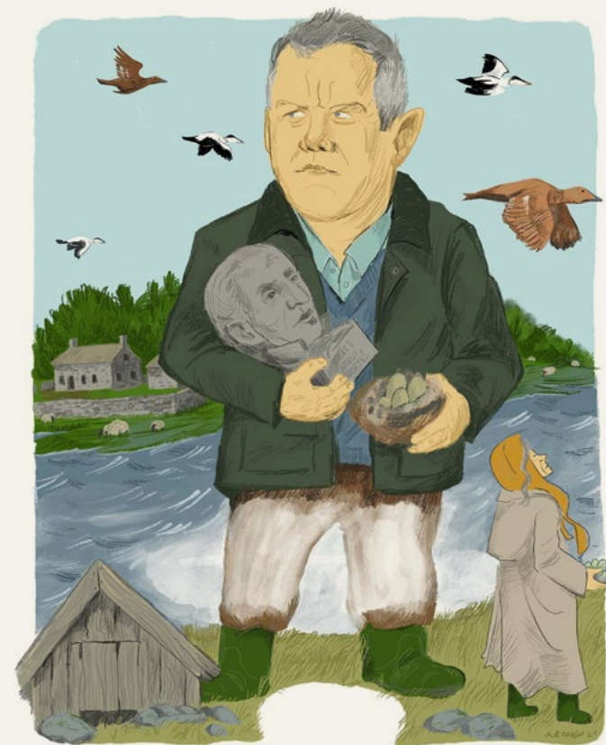
James Rebanks. Illustrasjon i Klassekampen 26. oktober 2024

I 2021 vart det vedtatt å løfte støling og hyttekultur som satsingsområde. I 2022 fekk museet 2,6 millionar kroner frå Kulturdirektoratet til tiltak på dette området. Prosjektet «Eit skigardsdele» har bidratt til auka kunnskap om forvalting av utmarka.