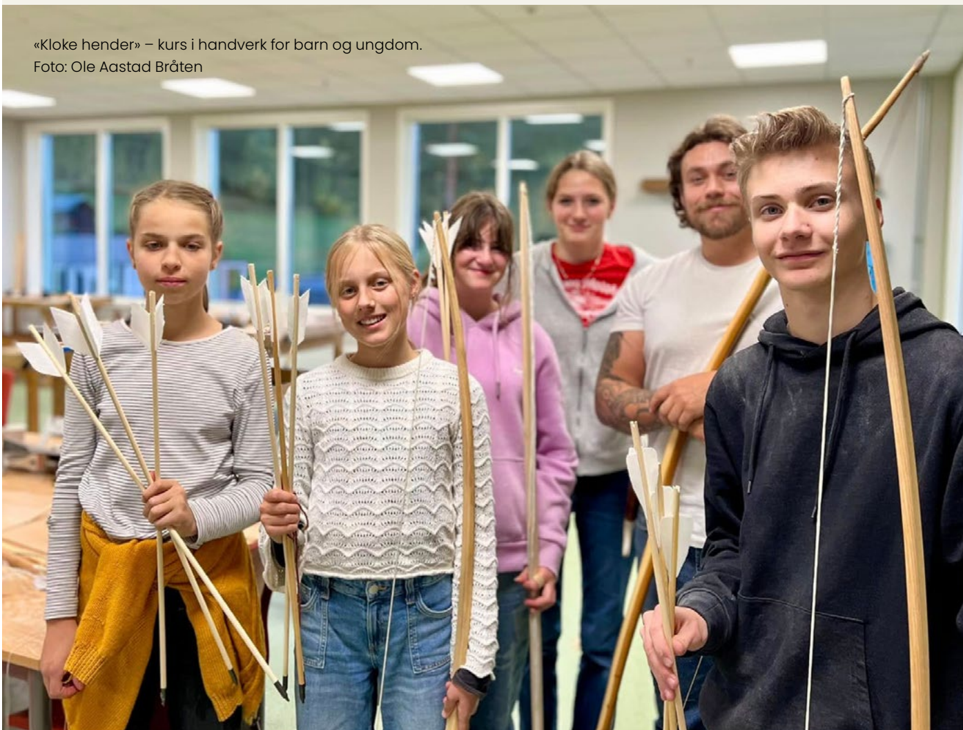
«Kloke hender» – kurs i handverk for barn og ungdom.