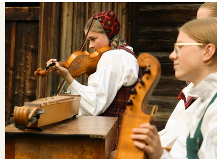
Folkemusikk er mål og middel i Valdresmusea sin strategi.

I lys av desse forholda vil det vere klokt å halde fram hovudlinene i dagens strategi. Derfor har ein òg løfta fram behovet for auka ressursar til både Norsk institutt for bunad og folkedrakt – og