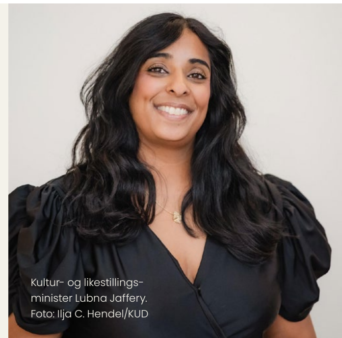
Kultur- og likestillings- minister Lubna Jaffery.

Saman med fem festivalar og overnattingsbedrifter har museet etablert eit bedriftsnettverk. Målet med nettverket er å samordne all innsats med pakketering, sal og marknadsføring. Ein gjennomførte i 2024 eit forprosjekt med støtte frå Innovasjon Noreg. Søknad om støtte til eit hovudprosjekt blir sendt i 2025.