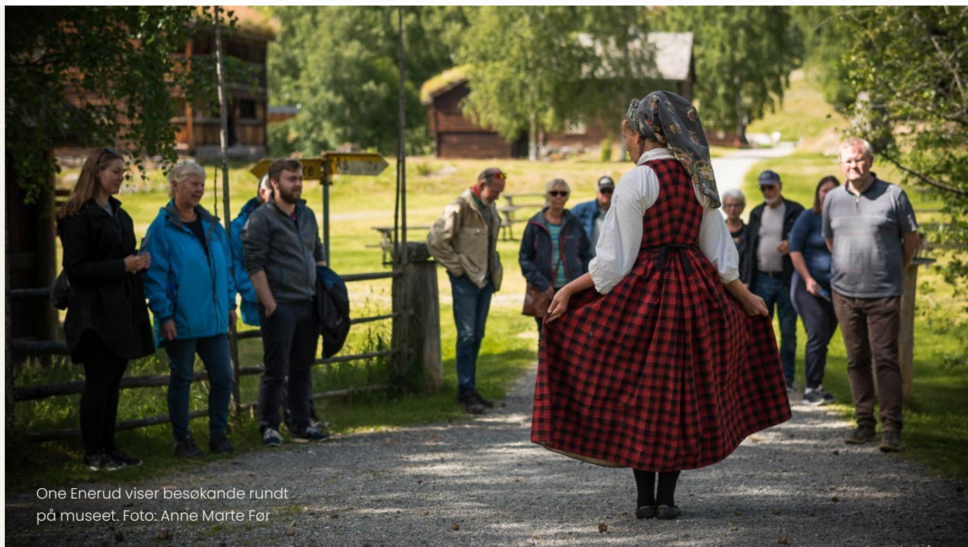
One Enerud viser besøkande rundt på museet.

Samla besøk ved Valdresmusea var i 2024 37 433 (36 309 i 2023). Om ein tel turgåarar i friluftsmuseet,