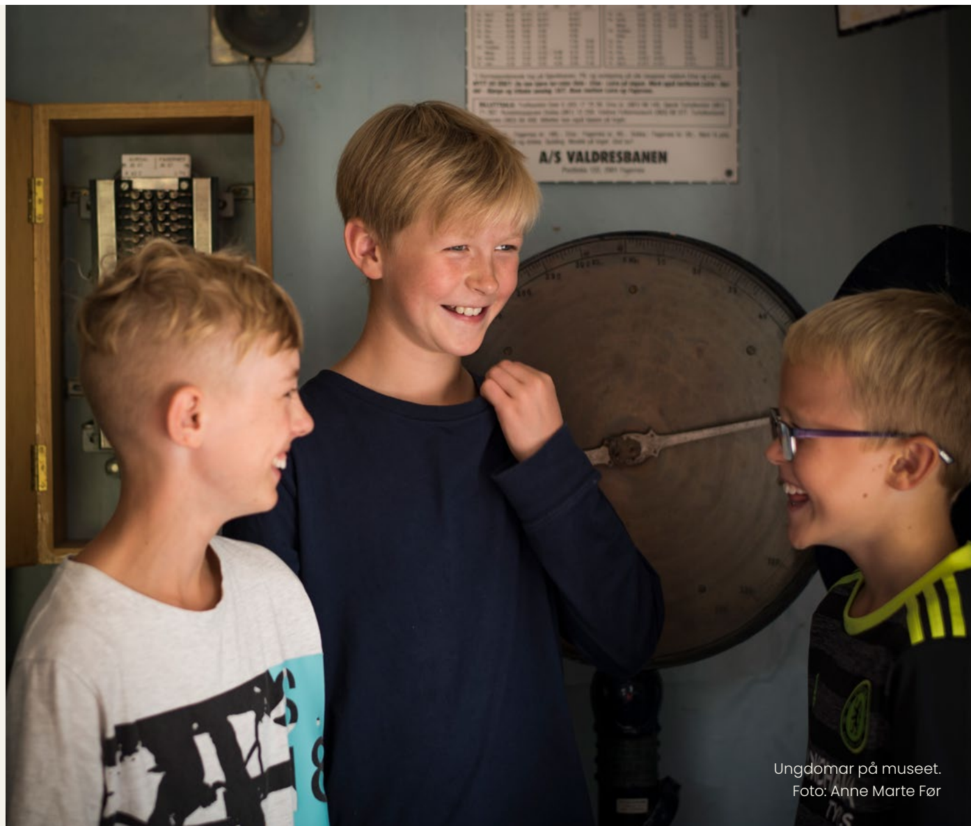
Ungdomar på museet.

Valdresmusea gjennomførte 149 opne arrangement i 2024 (185 i 2023).