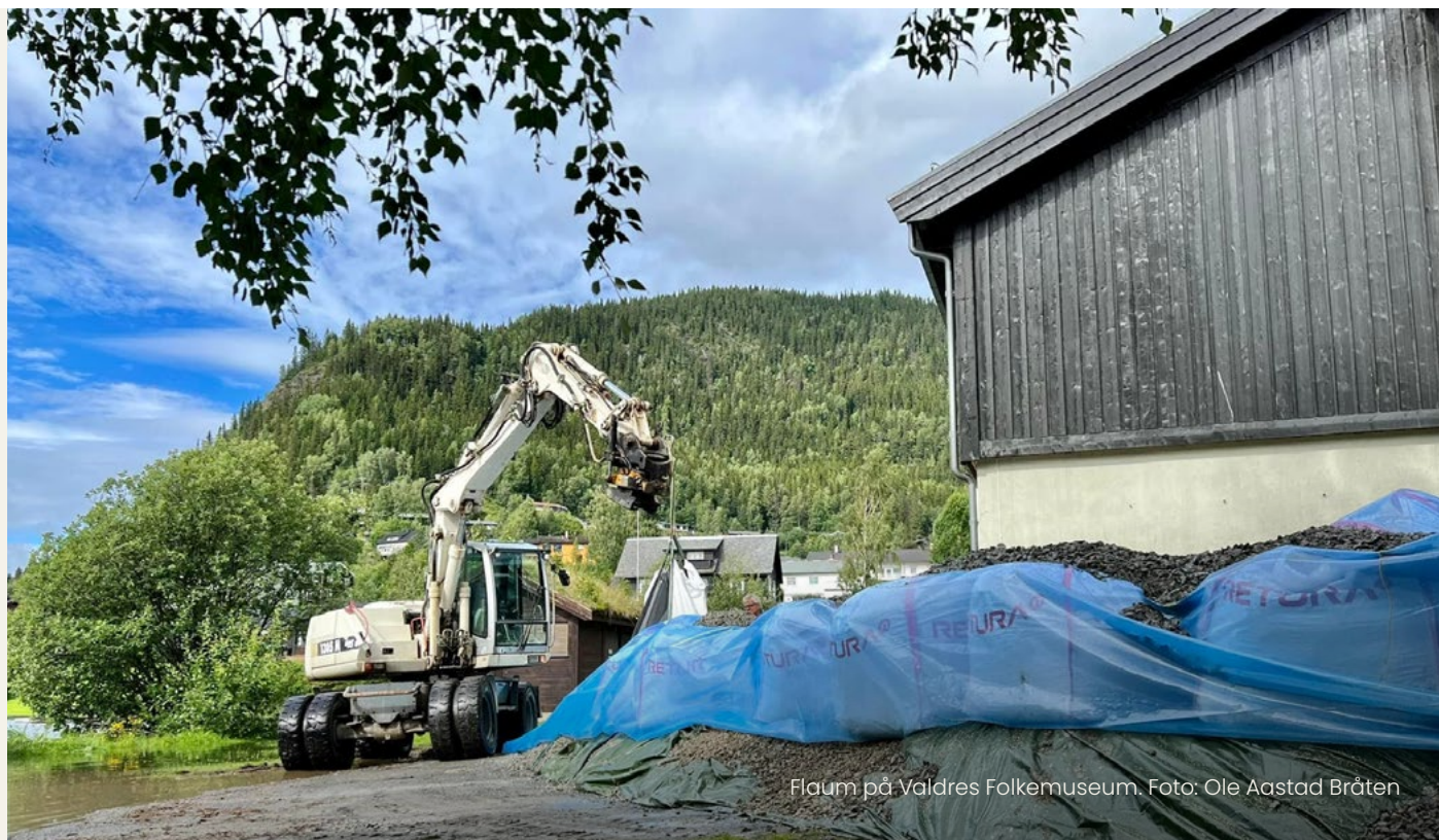
Flaum på Valdres Folkemuseum.

I samband med den omfattande rehabiliteringa av Velkomstbygget på Valdres Folkemuseum, fekk ein òg styrka bevaringsforholda for store deler av samlinga ved museet. I 2024 og 2025 blir det gjennomført behovsanalyse for bevaring av samlingane i fellesmagasin. Dette i samarbeid med dei andre musea i gamle Oppland.