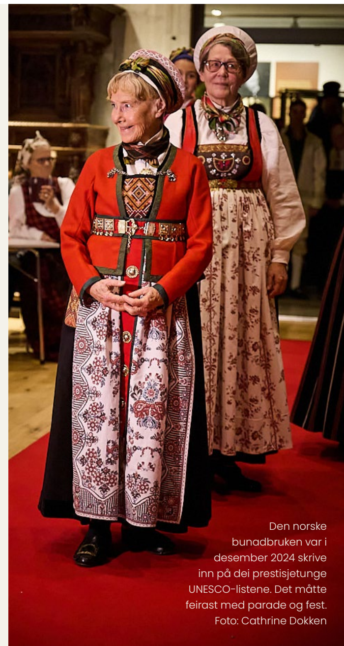
Den norske bunadbruken var i desember 2024 skriva inn på dei prestisjetunge UNESCO-listene. Det måtte feirast med parade og fest.

Valdresmusea har samarbeidd med Norsk seterkultur om formidling av setertradisjonar til unge og vaksne. Saman har vi løfta tematikken i kronikkar og meiningstoff, mellom anna i NRK Ytring. Med «Eit skigardsdele» har vi gjennomført konferanse på Lillehammer og ei rekke andre formidlingstiltak.