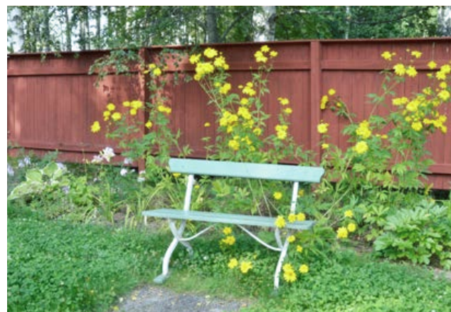
I Melinderska trädgården får grönskan rama in miljön utan att klippas alltför ofta.

Att låta grönytorna på området bli viktiga för att främja biologisk mångfald är ett sådant långsiktigt hållbarhetsarbete. En ny skötselplan synliggör biologisk mångfald och betonar vikten av fler blommor utmed stigar och vägar, fler ängsytor och flera och mera varierade träd och buskar. Som ett exempel kan nämnas Melinderska trädgården,