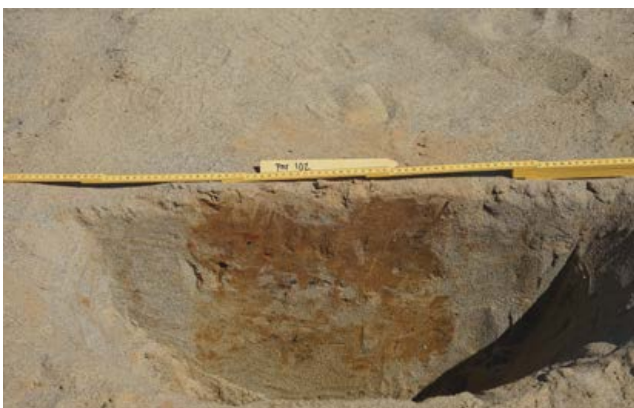
Ett stolphål i profil från långhuset i Östanå, Selånger socken.

Undersökningarna vid Byberget har bidragit ytterligare till kunskapen om länets tidiga invånare, men också visat på sjöregleringens negativa effekter på känsliga fornlämningar. Förhoppningen är att dessa insikter skall bidra till att andra liknande boplatser kan bevaras. Projek-