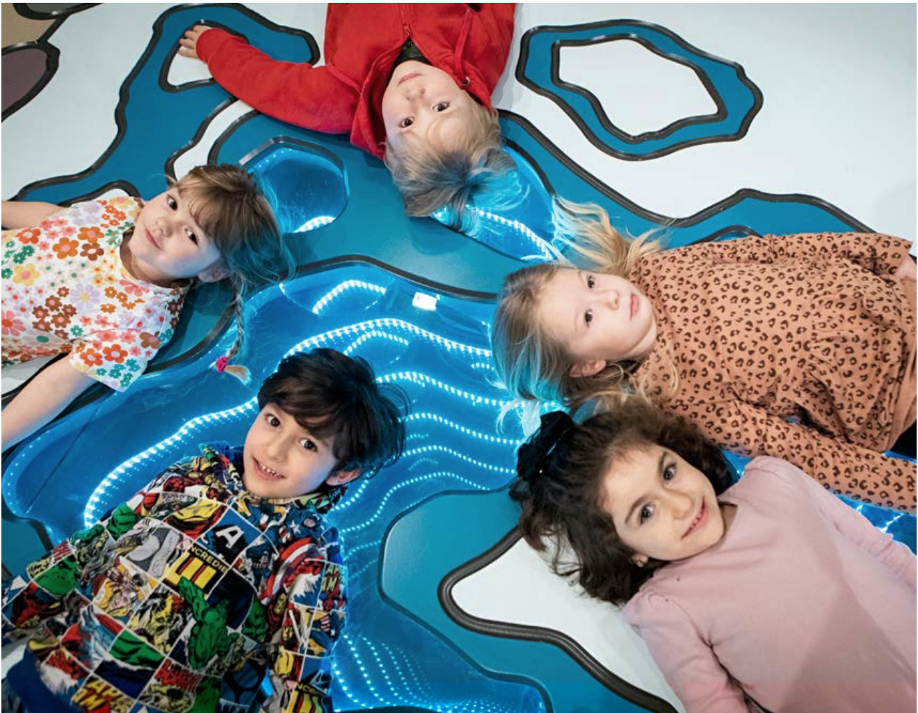
Utställningen Småfolk har under året varit välbesökt, särskilt under lovveckorna.

kulturarvsturism i Höga Kusten har till stor del upparbetat den totala projektbudgeten. Ett projekt som tillkommit under året är EU-projektet Bothnia Business Heritage, därav högre intäkter och kostnader i jämförelse med budget. Det externfinansierade projektet Framtidens kulturarvspedagogik har genomförts med ordinarie personalresurs, då projektledaren avslutade sin tjänst under året. Kostnaderna inom den pedagogiska verksamheten är därmed lägre än budgeterat.