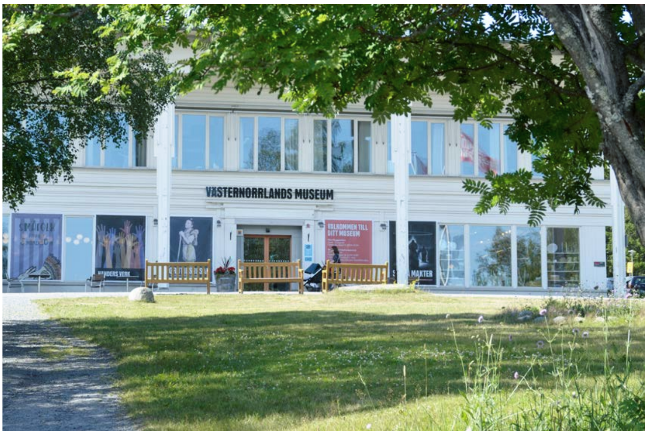
Huvudbyggnaden Västernorrlands museum.