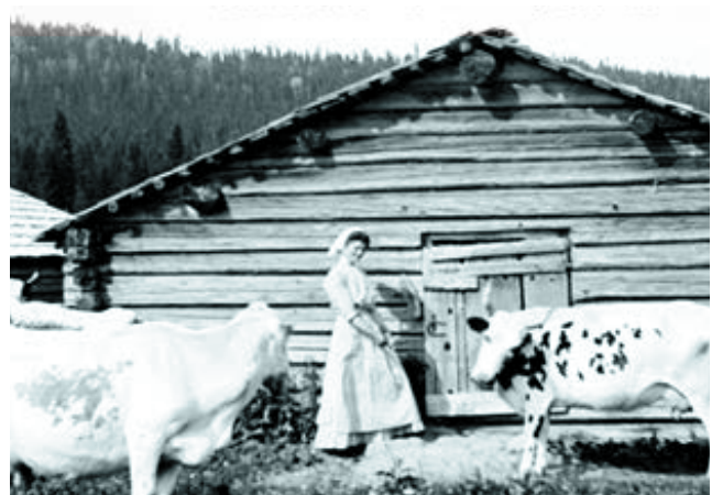
Föredrag om Fäbodbruk i Västernorrland.

Genom delaktighet på större sammankomster och styrelsearbeten vid bland annat Svenska byggnadsvårdsföreningen och föreningen BARK, årets Fäbodriksdag i Ånge; Sundsvalls Byggnadsförening samt Dalarnas och Västmanlands regionala kulturmiljökonferens, har museet också bidragit till nätverkande, kunskapsutbyte och omvärldsanalys på nationell nivå. Det visar dels vilken efterfrågan som finns på museet kunskaper, dels hur viktigt det är att bekräfta kulturarvets värde från flera håll.