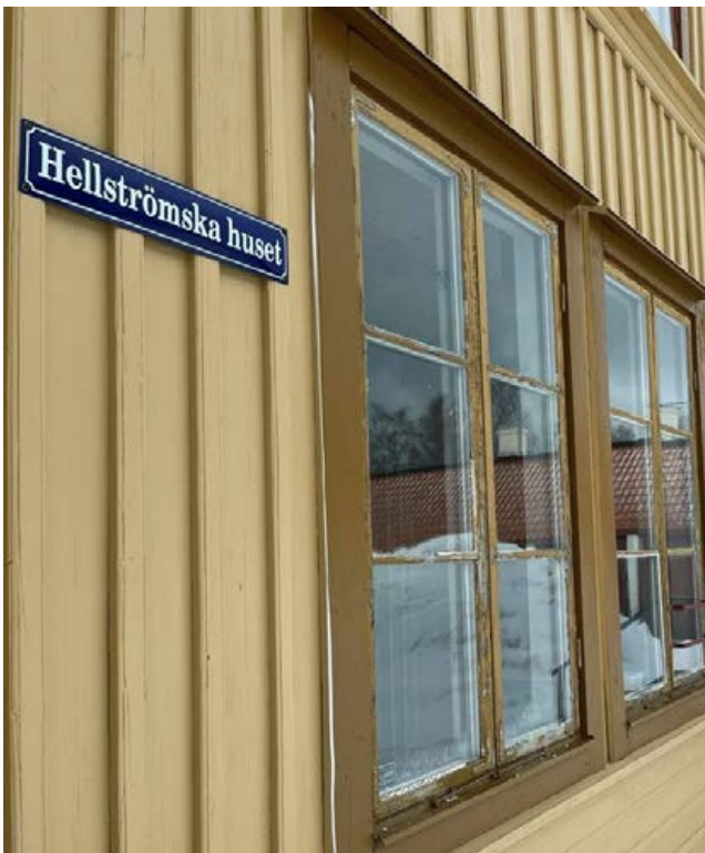
Renoveringen av Hellströmska huset startade 2023. Från och med 6 juni 2024 går det titta in i lokalerna.

vars "gräsmatta" består i princip bara av vitklöver som klipps ett par gånger per säsong och verkligen surrar av liv numera. Områdets mellanytor och dikesrenar lämnas oklippta så att vädd, blåklockor, rödklöver och annat får blomma. När insatser genomförs vill vi alltid se till att också berätta om dem och varför de är viktiga. Förhoppningen är såklart att besökarna ska inspireras och ta med sig några av dessa tankar kring biologisk mångfald hem, kanske låta gräsmattan förvandlas till en blommande äng och inte ängslas över maskrosorna så mycket. Annan kunskapsförmedling som vi gärna ser att besökarna tar med sig hem är kunskapen om vilka växter man hade i sina trädgårdar och parker förr, något som kan bidra till att vi behåller det levande kulturarvet in i framtiden.