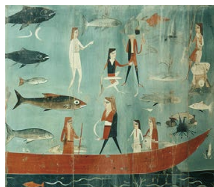
Samtliga bilder är illustrationer till Kulturarvsresan.