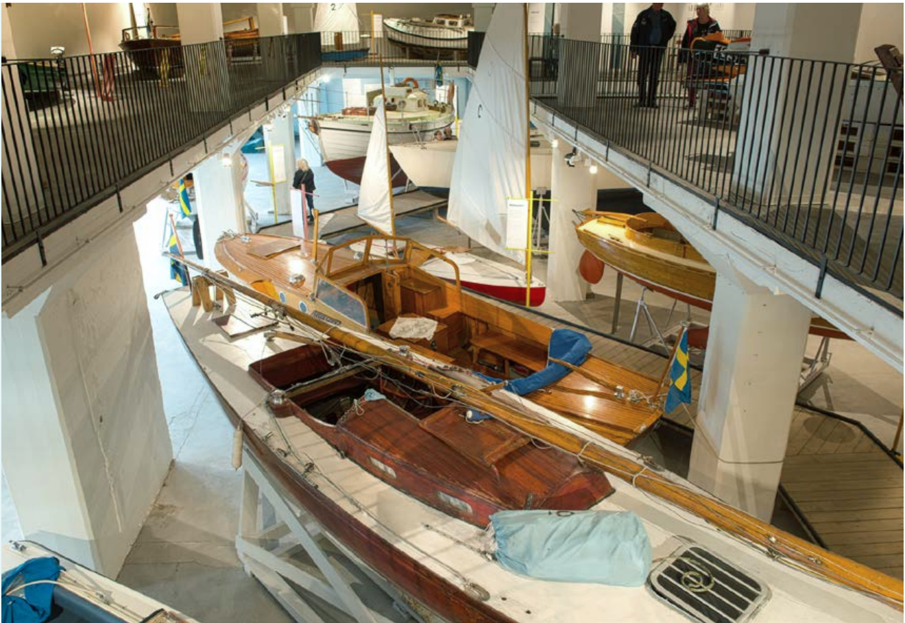
Överblicksbild från Fritidsbåtmuseet innan båtar och andra föremål började flyttas ut.