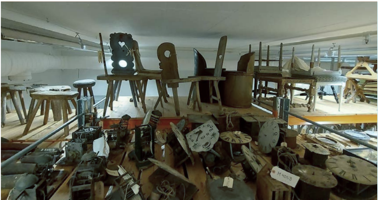
En del av arbetet är att nyttja utrymmet maximalt, samtidigt som brandskyddet garanteras.

Parallellt med brandskyddsprojektet har det under 2023 inletts ett arbete med att flytta cirka 8 000 textila föremål, från museets magasin i Sollefteå till museibyggnaden i Härnösand. Flytten ska vara helt genomförd innan slutet av 2024. Samtidigt som flytt av föremål skett i brandskyddsprojektet har projektering genomförts för att kunna rymma de textila samlingarna i museibyggnaden. Utmaningen i de båda projekten är att maximera förvaringen och utnyttja befintliga system i så stor utsträckning som möjligt.