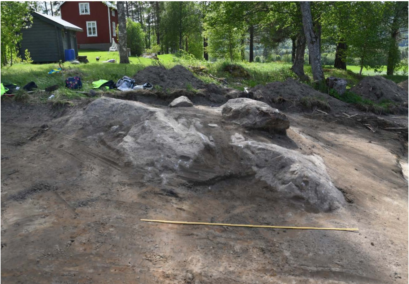
Gravläggningsen på bergknallen under stenblocken i Boteå, Boteå socken.

Arkeologi kan sätta vår samtid i perspektiv, men det handlar inte bara om de levandes miljöer utan också om de dödas. I Boteå, strax norr om Ångermanälven har järnålderns människor begravts i högar och på gravfält. Dessa är i många fall fortfarande synliga i landskapet och om de blivit bortodlade i senare tid finns det ofta skriftliga uppgifter om dem kvar. Det är med andra ord inte så vanligt att vi påträffar synliga, hittills okända gravar. Det var dock vad som hände vid en förundersökning inför en kabelnedläggning i somras. Precis invid en liten bergknalle framkom vid schaktning plötsligt en bit av ett eldpåverkat bryne och några brända ben. Vid en närmare undersökning visade det sig att dessa hade ramlat ned från en gravläggning ovanpå bergknallen. På toppen av den var en nedsänkning vari man hade lagt ned de brända benen från den döda och ovanpå dessa hade några stora stenblock placerats. Runtom om bergknallen var flera härdar