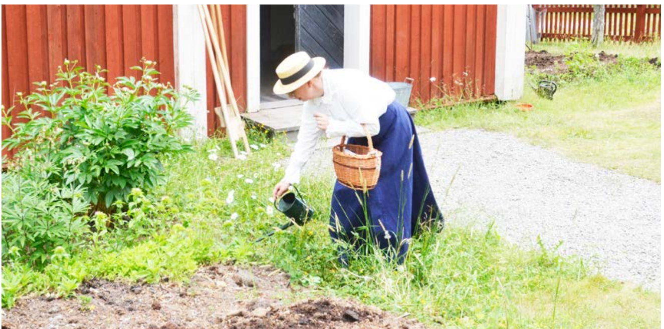
Trädgårdsarbete utanför skolan.

Ytterligare ett helt nytt samarbete på friluftsmuseet är med Film i Västernorrland och Filmfonden. Några av miljöerna på området är nu listade i ett nyligen upprättat "location register" för miljöer tillgängliga för filminspelningar. Museet är på så vis delaktiga i Film Västernorrlands nätverk som, syftar till att fungera som stöd i att hitta eller föreslå lämpliga miljöer till filminspelningar runt om i länet. Detta är ett tydligt exempel på hur kulturarvet kan vara en del i länets utveckling.