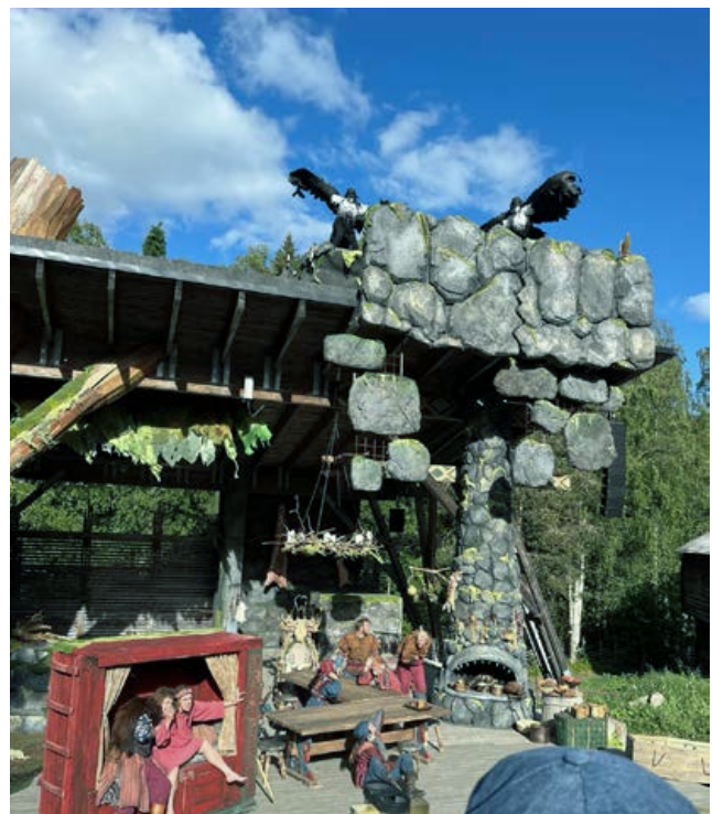
Teater Västernorrlands uppsättning av Ronja Rövardotter på museets utescen.

lands museum och 5i12-rörelsen. Arrangemanget, som är ett sätt att öka förståelsen mellan olika kulturer, har under många år varit en stor publikdragare som lockar med mat och musik från olika länder och blir ett sätt att möta många olika kulturer på en och samma plats. Årets fest hade tio länder representerade genom maträtter som serverades från marknadsstånd som ställts upp på området. Scenprogrammet genomfördes på utescenen. Ett annat exempel på lyckat samarbete var Sarah Dawn Finers sommarkonsert på utescenen med Stella event som arrangör.