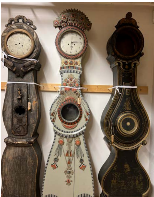
Nya föremål från samlingarna har tagits fram och restaurerats för att ta plats i den nya utställningen och några har fått flytta ner i arkiven igen.