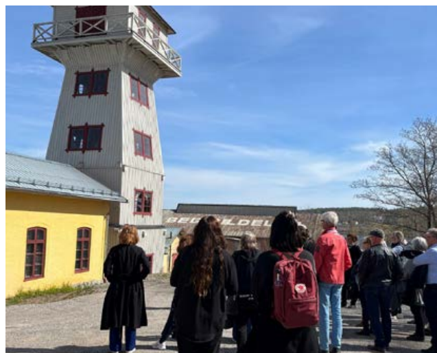
Platsbesök i Svartvik.

hållits nio seminarier under våren, och många har varit intresserade av att delta. Innehållet har kretsat kring kulturarvets roll för regionen, storytelling och transmedialt berättande, museers värde och sociala effekter, industrihistoriska miljöer och platsutveckling, med mera. I seminarieserien har museets olika projekt samverkat för att skapa ett intressant utbud.