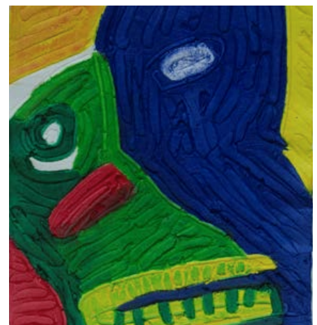
Bild 1. Utställningen Näver. Bild 2. Datni av Matti Aikio. Bild 3. Bengt Lindström ur samlingarna.