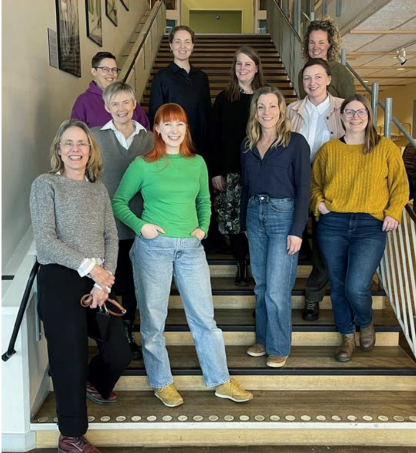
Deltagare i Kulturavsinkubatorn.

Det som händer inom dessa projekt och andra projekt som drivs av museet har förmedlats via Nyhetsbrev Samarbeten och på museets webbsida under rubriken Samarbeten & nätverk. I olika sociala medier förmedlas information om arrangemang och evenemang, framför allt har LinkedIn blivit den kanal som används. För oss är dessa format sätt att paketera en helhetlig bild av den nya roll som museet utvecklar för att stärka kulturavets roll i samhällsutvecklingen, och för att få intresserade att känna till utvecklingen och vad de kan ta del av.