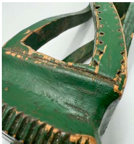
Detaljbilder från utställningen LIN.LIN.LIN.