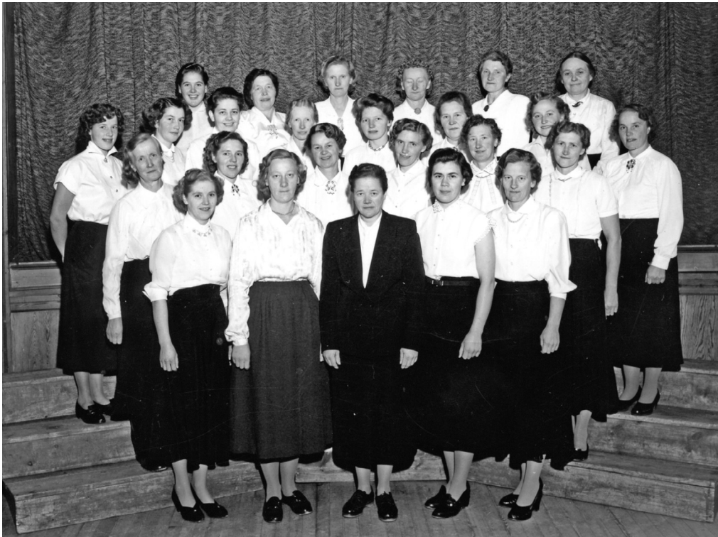
Vingelen damekor på 1950-tallet.

spissen som ivret for å stifte et damekor.