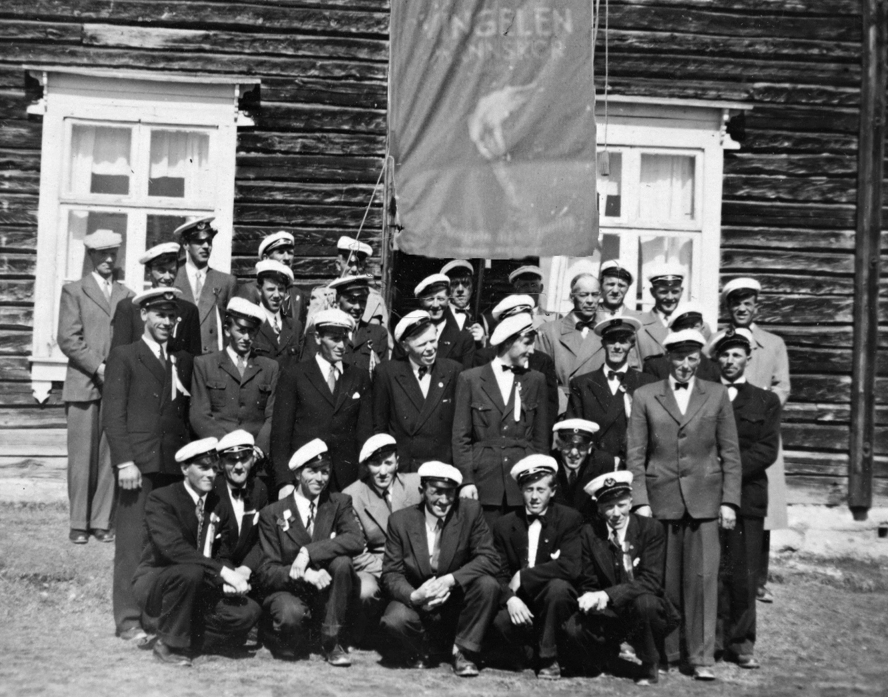
Vingelen mannskor 17. mai 1955. Fana vart innvidd denne dagen. Huset i bakgrunnen er gamle Fjellheim, der kora, leikarringen og musikkforeninga hadde sine øvinger.