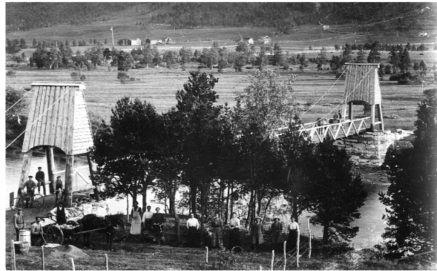
Vollanbrua, bygd av Johannes Sand 1897. Repro: MiNØ 32458.

Dagens Vollan-tun ble kjøpt av Tynset kommune i 1969, etter forutgående drøftinger i tidligere Kvikne kommune. Denne handelen omfattet ikke fjøset. Det fulgte med innmarka til fortsatt Vollan-bruk. Men etter stormen hadde tatt overbygget ble fjøsrui-nen kjøpt av Tynset kommune i 1990. Da ble fjøsdrifta flyttet til et annet Vollanbruk.