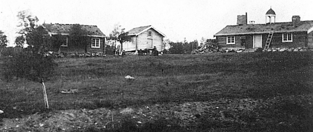
Setra til Vollan, ca 1900.