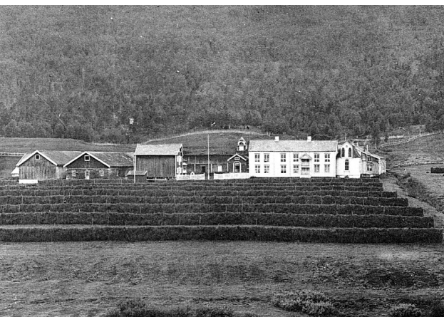
Vollan, ca 1900. Det er to fjøs ved sida av hverandre, stabburet står og bak kapellet skimter vi påbygget på nyfløya, stallen ser vi ikke mye av, men den var over 50 m. Repro: MiNØ 28811.

sida av det nye byggverket. Gammelfløya, som altså skriver seg tilbake til 1630 og ombygd i 1768, var for låg. Nå starter et merkelig byggeprosjekt. Fløya ble påbygd i høgda, den fikk nytt tak, panelt og nye vinduer. Tilsynelatende lik nyfløya. Men hele denne påbyggingen er stafasje, under står det gamle huset intakt, påbygginga er blindloft og påmalte vinduer, ikke noe utvidet areal eller mer plass. Men på avstand ser det imponerende ut. Torvtaket fra 1768 ligger urørt på det nye blindloftet. Fløy-ene ble i alle fall stående i stil med hverandre. Ei dukkestue fra 1850 hørte også med i tunet og et dueslag.