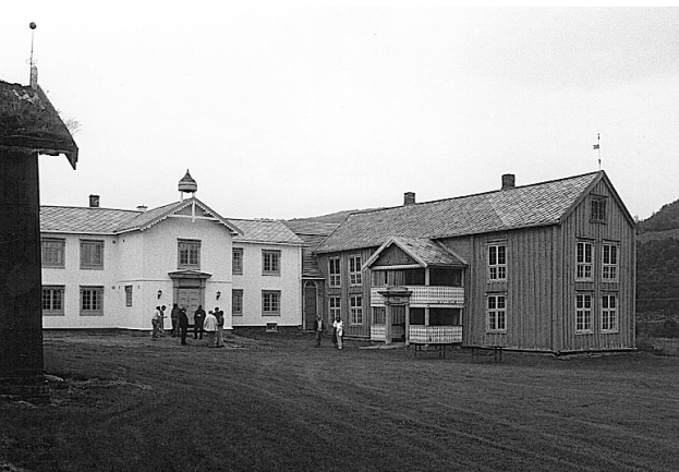
Dagens Vollen.

åra. Ønsket var å settes i stand til leilighet i øverste enden og felleslokaler i delen mot kapellet. Etter tegninger fra arkitekt Tor J. Østvang ble arbeidet gjennomført under ledelse av byggmester Kurt Fossum. Midler ble hentet fra kommunens næringsfond, lån på antikvarisk grunnlag og ulike typer sysselsettingsmidler.