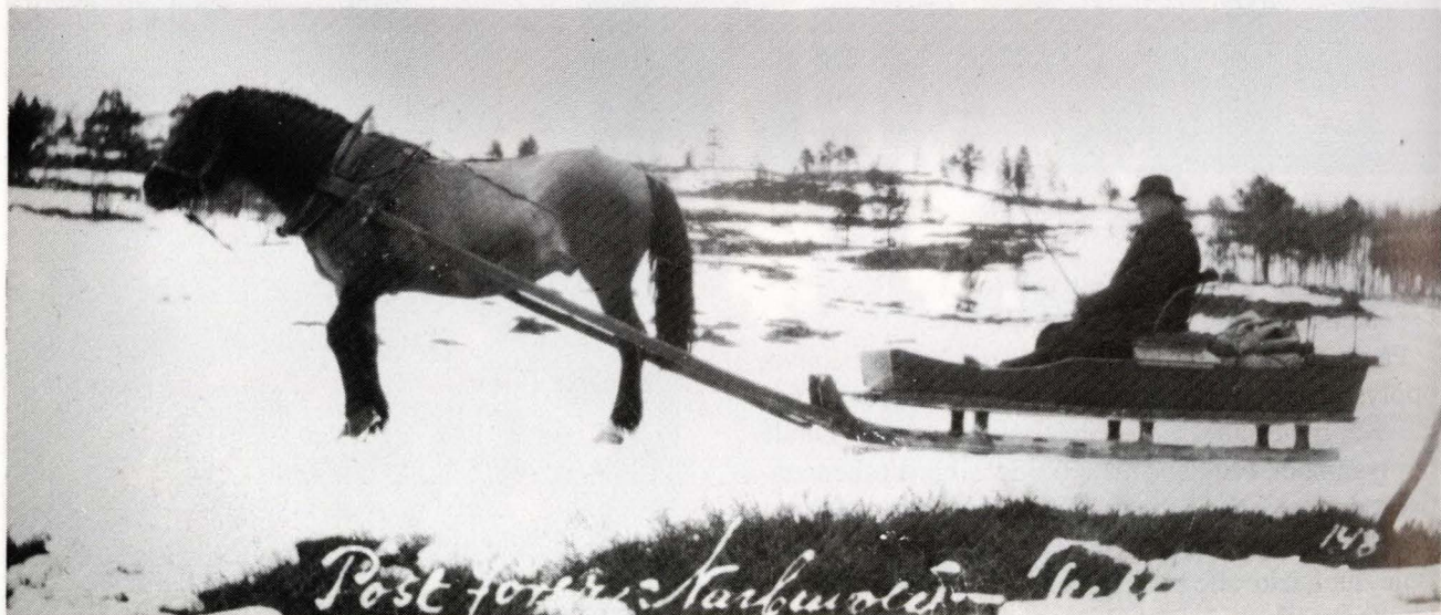
Fra Midtdal, søndre og nordre, Tufsingdalen. (36134).