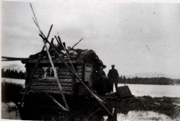
Fiskebua Grønland ved Femund. (36080).