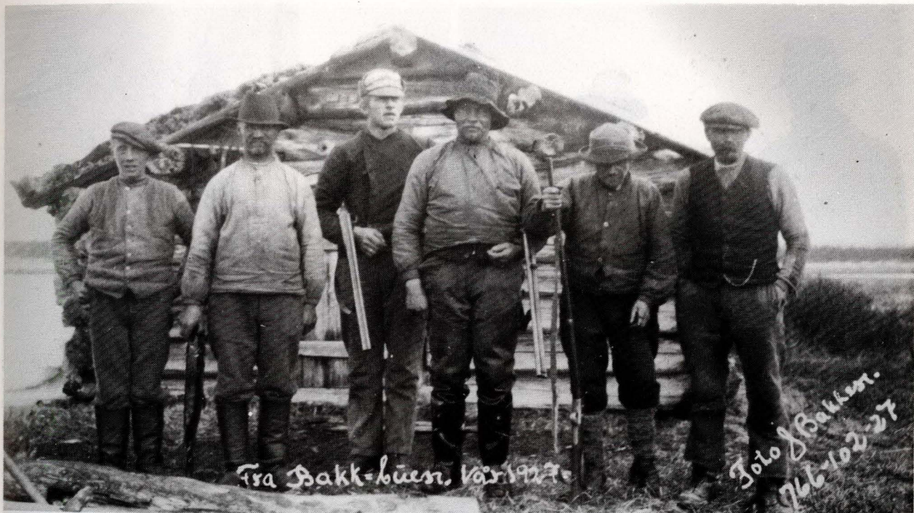
Fra Bakk-bua, våren 1927. (36245).