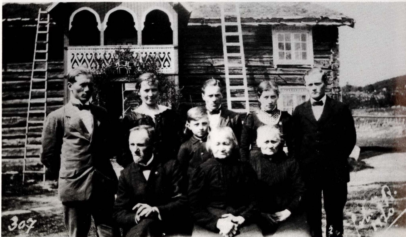
Familien på Bakken nordre. (36072).