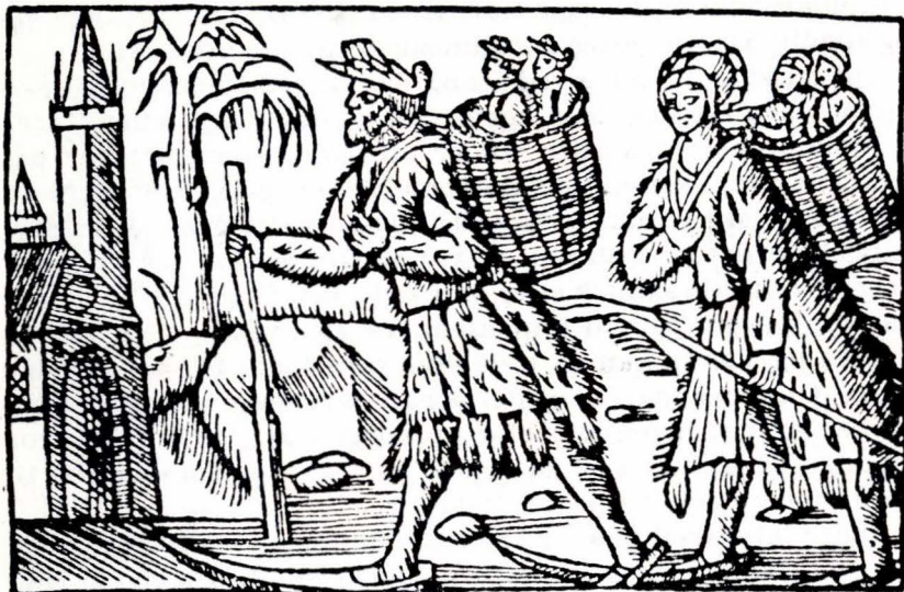
Samanane i Norden, slik Olaus Magnus skildrar dei frå 1500-talet.