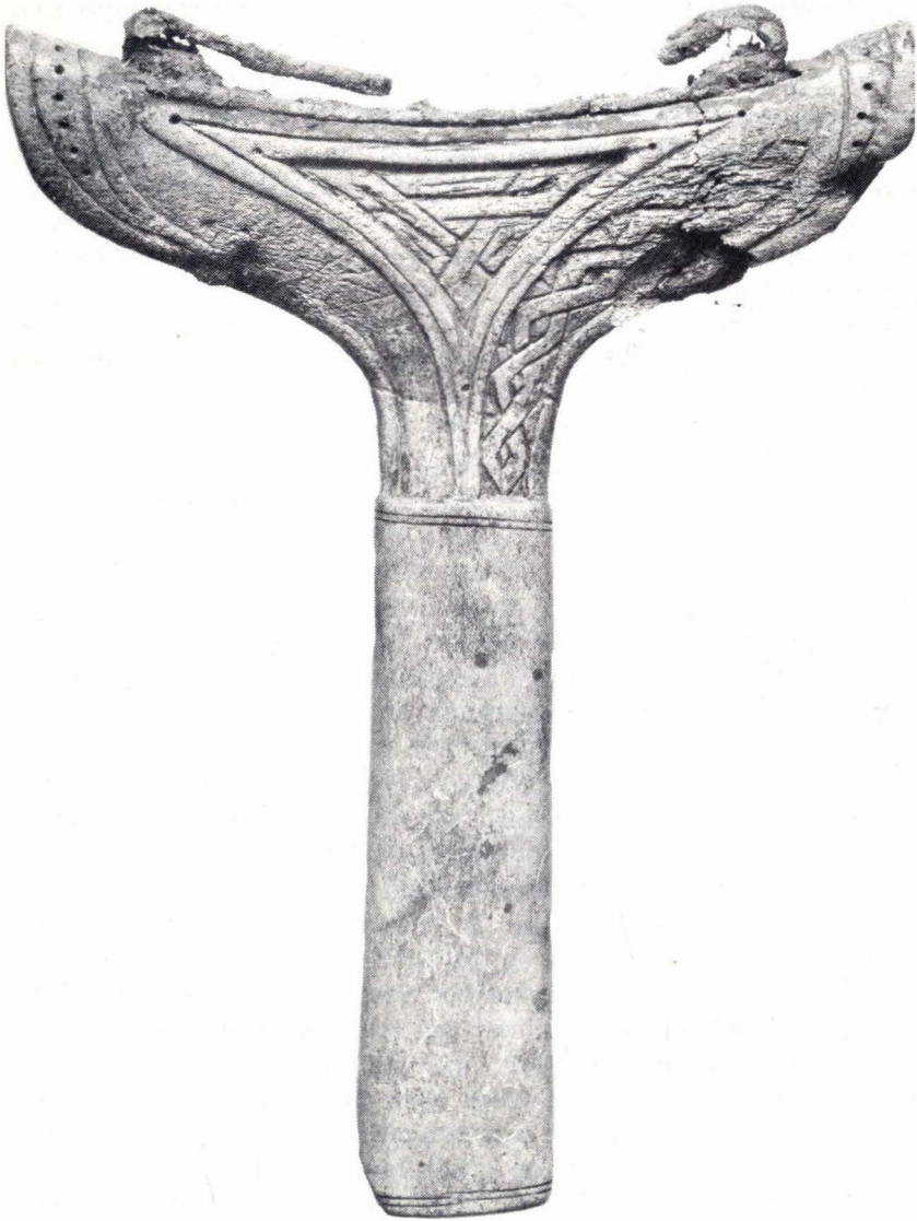
Runebommehammeren frå Øvre Randalen.