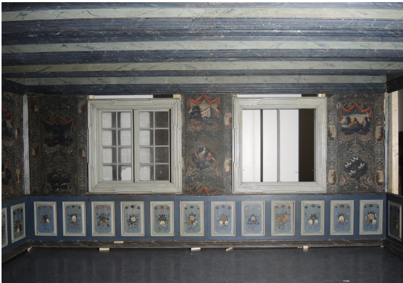
Den ene vindusveggen prøvemontert i 2016. Innredning og lerretstapet er fra 1730-årene mens den malte dekoren på brystpanel og himling er datert 1759.

gapestokk. Men verre var at ingen ukonfirmert kunne gå ut i arbeid, tas ut til militærtjeneste, inngå ekteskap, være fadder ved dåp eller være vitne i retten uten konfirmasjonsattest. Derfor ble det i 1739 innført almen skolegang i Danmark-Norge. Hensikten var at alle barn skulle få innføring i religion samt lære å lese, for dermed å lette kristendomsundervisningen. Rundt om i bygdene var det prestenes oppgave å finne lærere til elevene.