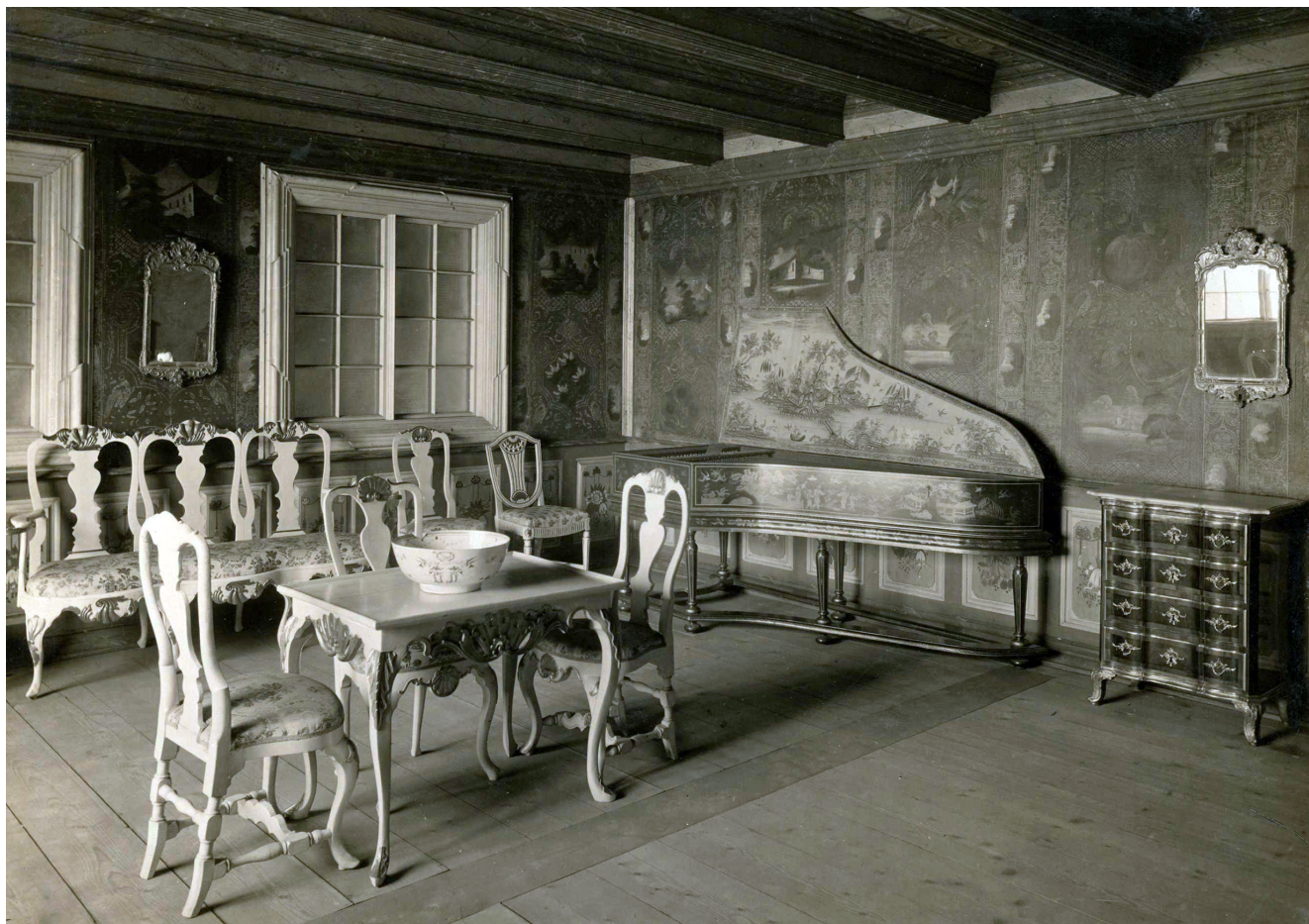
Rommet slik det sto møblert på Norsk Folkemuseum i årene 1938 til 1949.