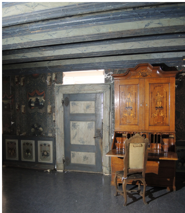
Hjørne under prøvemøblering med skatoll og stol.

med Wolff og hans første hustru Dorotheas navnetrekk foruten følgende linjer: