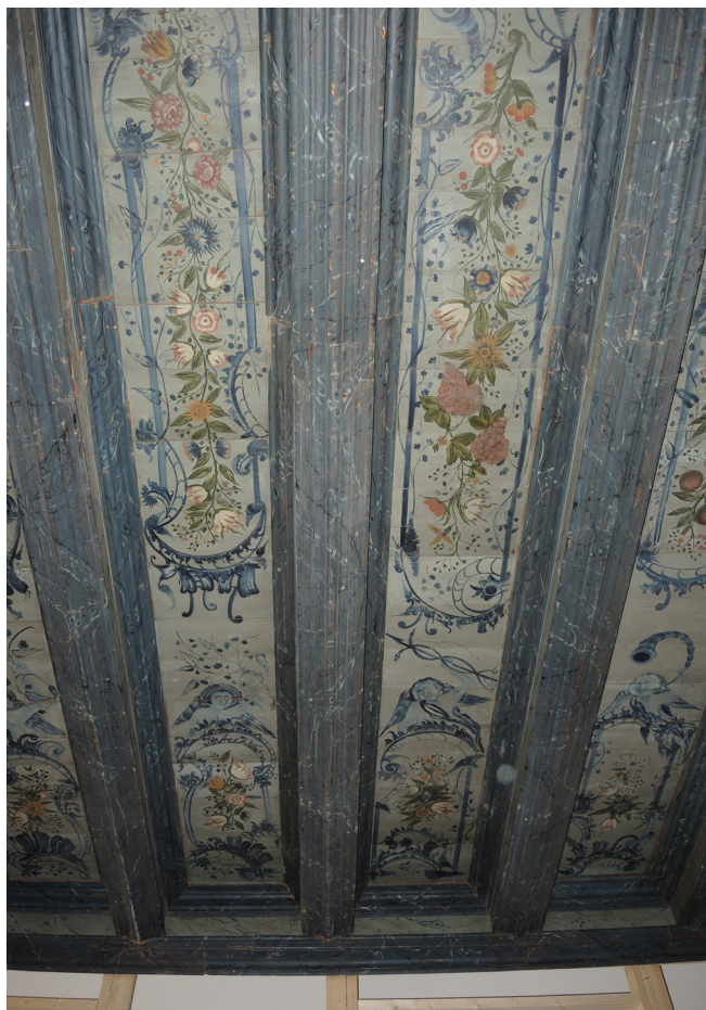
Himlingen vist under prøvemontering. De rikt dekorerte feltene mellom takbjelkene ble malt i 1759, samme år som Wolff inngikk sitt andre ekteskap.