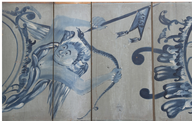
Over til venstre, detalj av himlingens rike dekorasjonsmaling, med blomster mellom rokokkoornamentikk i mørkere blånyanser. Over til høyre, detalj av himlingen med amoren med årstallet 1759, malt i mørkere blånyanser på lys blå bunn.

representative værelser i første halvdel av 1700-tallet. Veggene har brystpanel med rikt profilerte fyllinger typiske for senbarokken på 1730-tallet, samt lerretstapeter fra samme tid. Taket er panelt med synlige bjelker, der vi gjenkjenner senbarokkens kraftige og profilerte listverk. Interiøret slik det er bevart representerer imidlertid to ulike faser i rommets historie. For det første den opprinnelige snekkermessige innredningen med brystpanel, dør, vinduer, listverk og himling samt lerretstapetet, som begge er preget av 1730-tallets senbarokk/regéncestil. Dernest stammer brystpanelet og takets malte rokokkodekor fra en modernisering utført av Wolff i anledning inngåelsen av hans annet ekteskap i 1759.