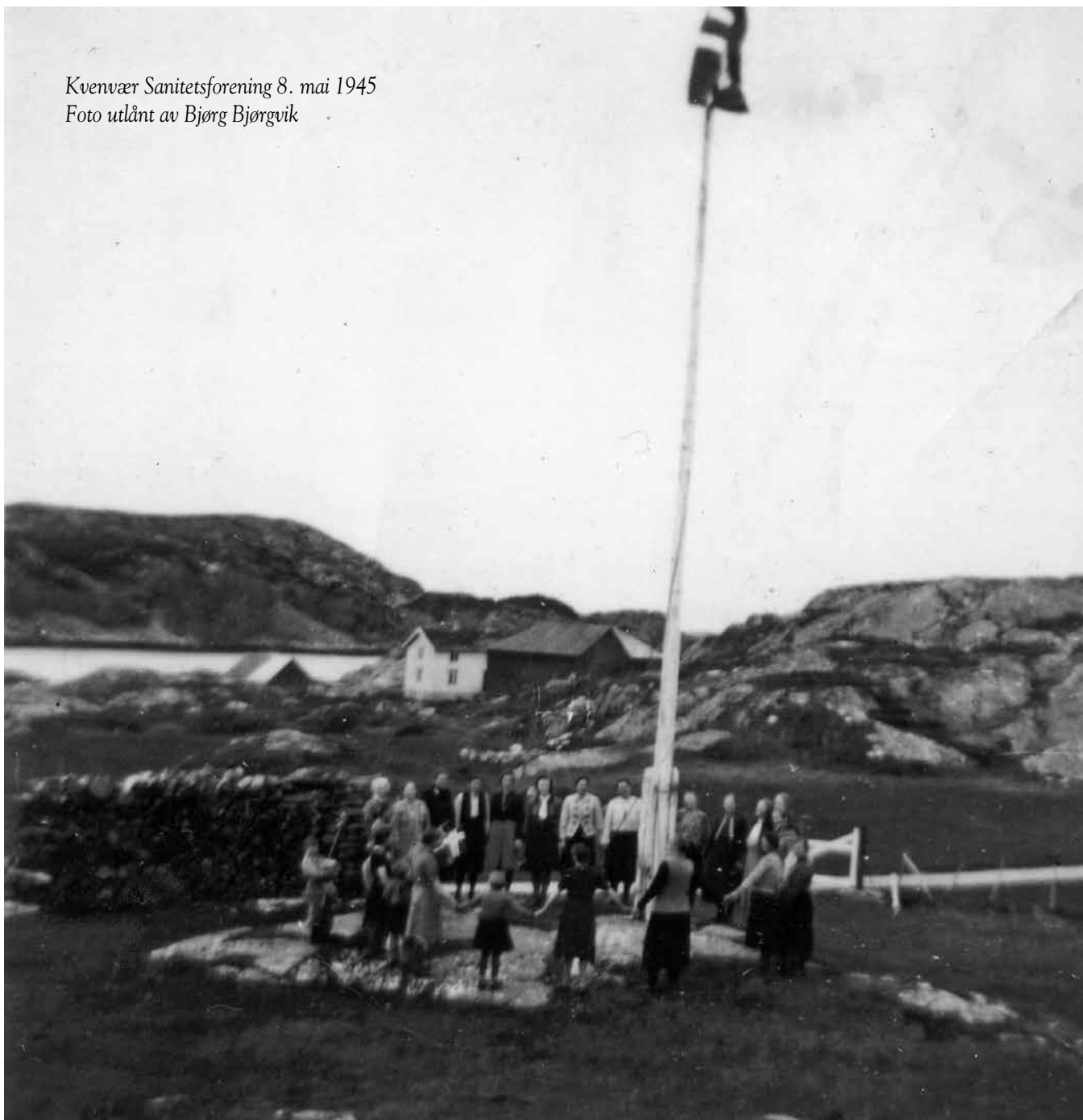
Kvenvær Sanitetsforening 8. mai 1945