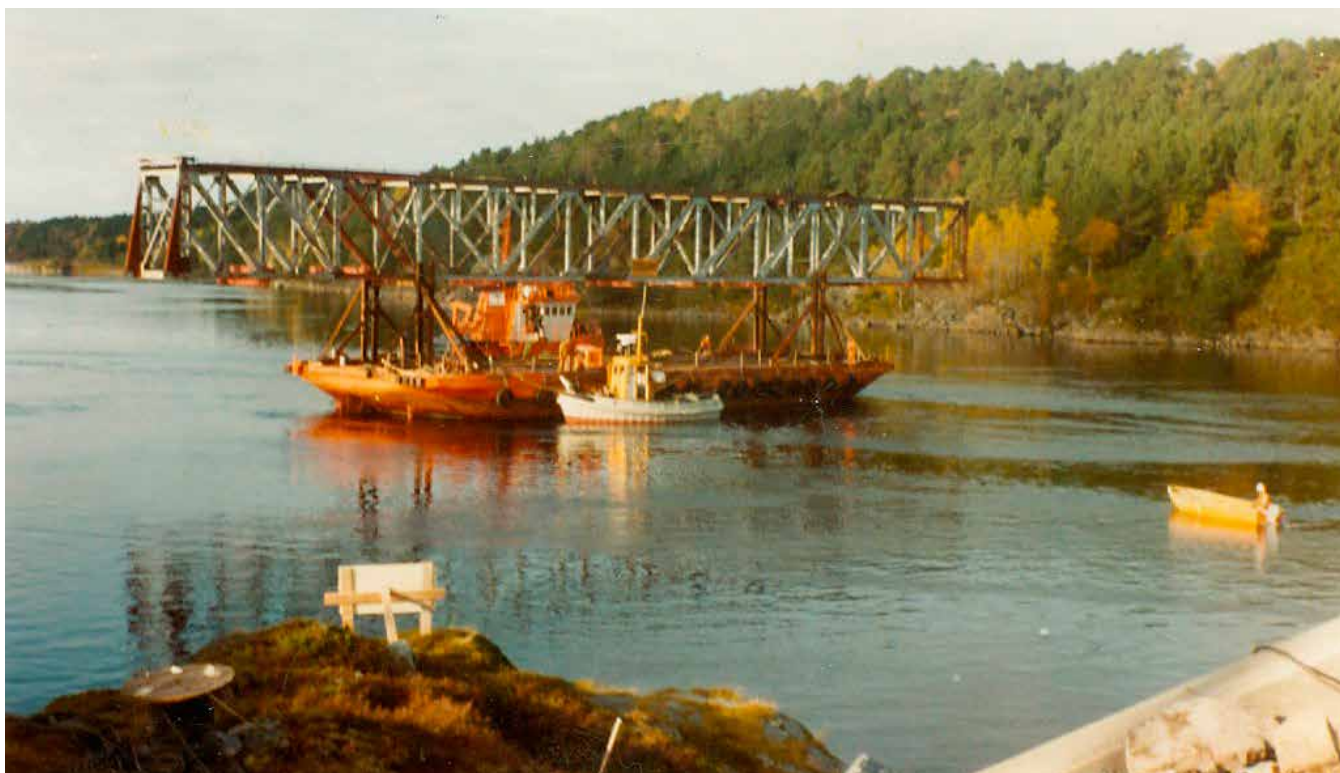
Kullkrana som ble til ei bru.