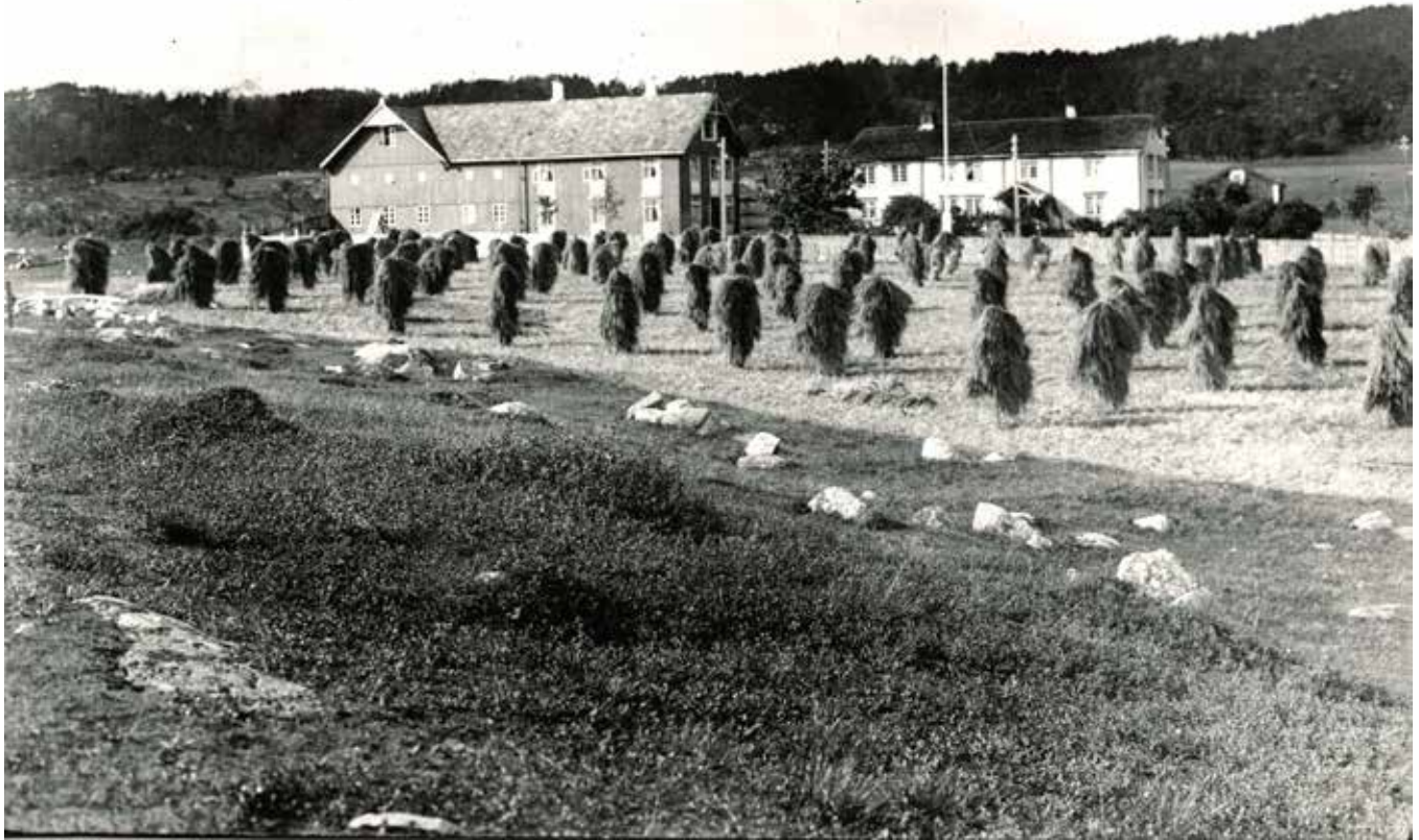
Hamna i 1906.

poståpner, dampskipssekspeditør og telefonbestyrer, og seinere begynte han også med landhandel i Hamna.