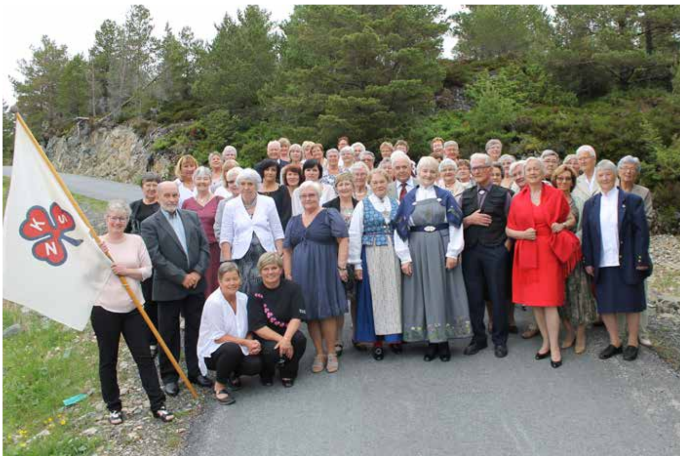
Her er mange av Hitras sanitetskvinner sammen med noen staute karer samla til grendastevne ved Idrettshuset på Sandstad 9.juni 2013.

Nå i 2013 er det fortsatt elleve sanitetsforeninger i virksomhet på Hitra. Disse er: Ansnes, Barmanfjord, Fillan, Fjellværøy, Heggåsen, Hitra, Knarrlag-sund, Kvenvær, Sandstad, Sør-Strømfjord og Tranvik. Asmundvåg sanitetsforening er den siste som ble lagt ned. Det skjedde dette året.