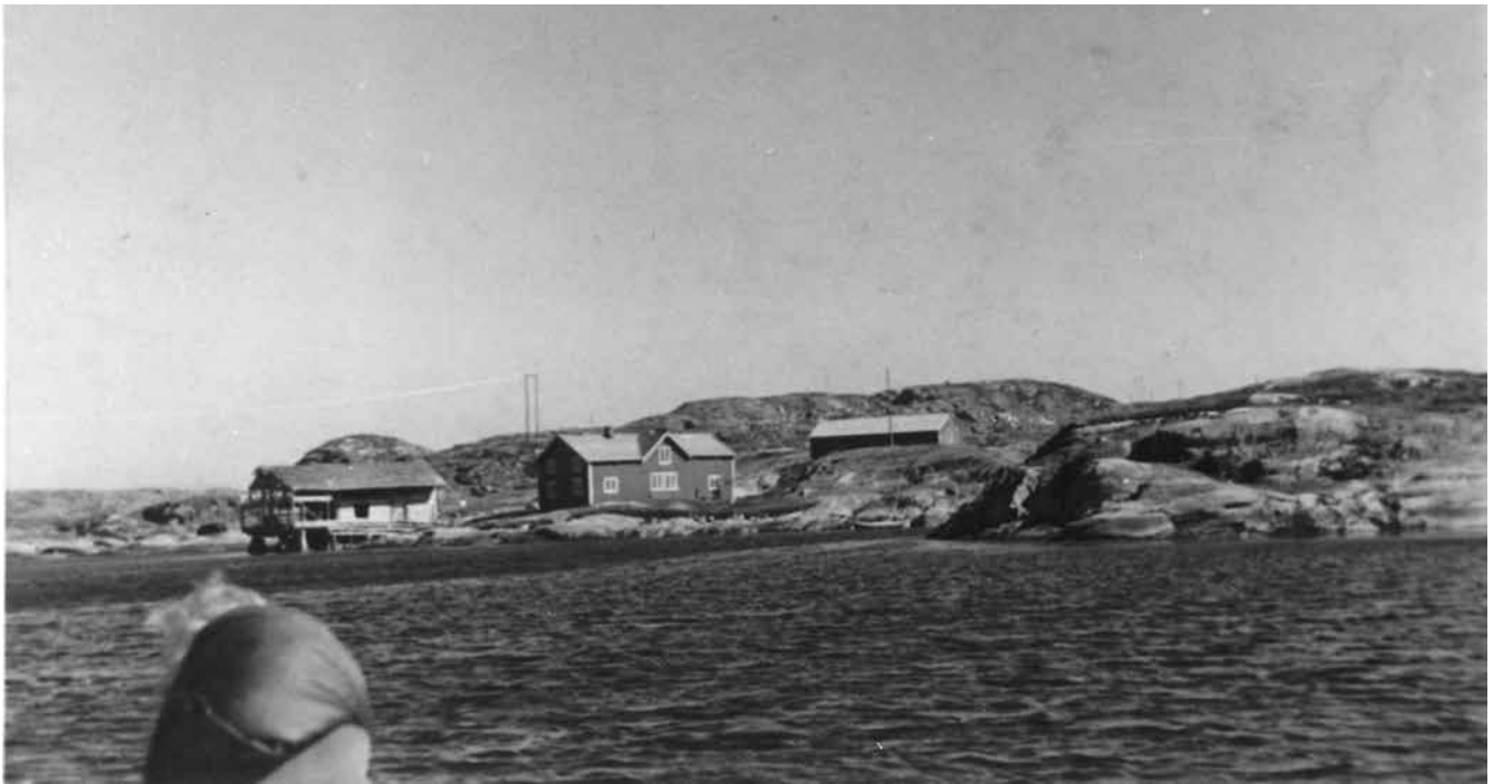
Hovudbygninga og brygga på Rørøy i 1963.