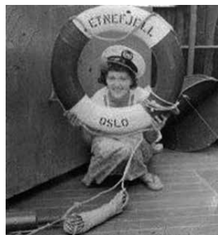
Blid messepike om bord på M/S Etnefjell

De færreste kvinnene valgte en yrkeskarriere til sjøs der de gikk gradene. Ikke hadde de så mange muligheter heller, da det var kun et rederi i Norge som tillot kvinner å