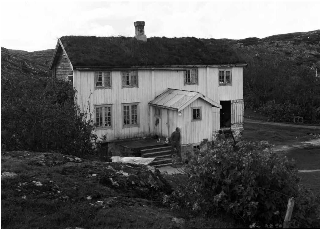
Dette er Ingebrigtsvika rundt midten av 1900-talet. Bygninga er frå Elisabet og Erik Hægstad si tid, trulig bygd som kårstue for dei.