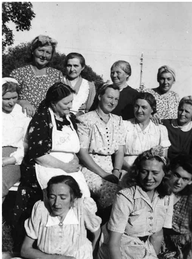
Sanitetsdamer fra Asmundvåg på besøk i Hamna midt på 1950-tallet.

For å få penger i kassen, ble det på første møte etter stiftelsen besluttet å holde juletefest første nyttårsdag.