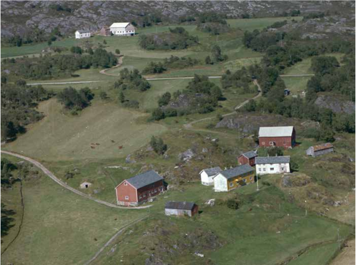
Jevika.