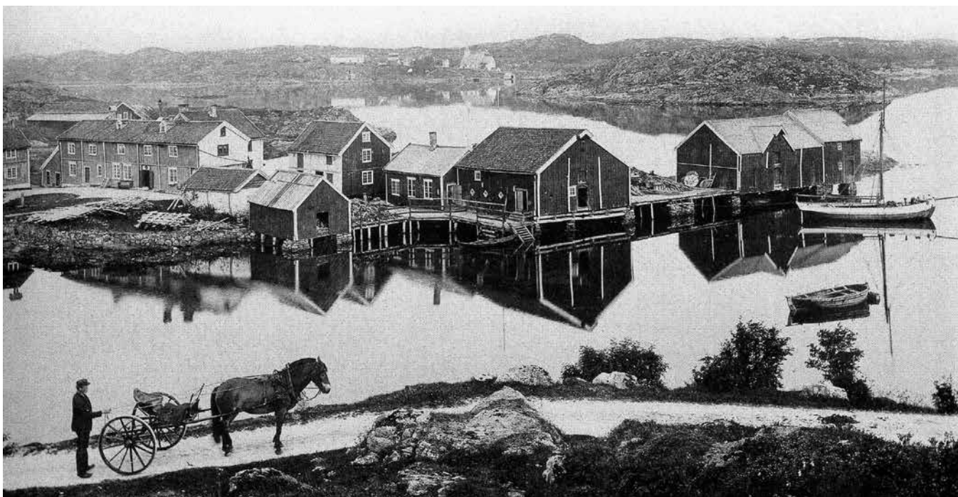
Handelsstedet Hopsjø slik det var rundt 1890.

fall at offiser i Hæren var et vanlig yrke i de nærmeste mannlige ætteledd.