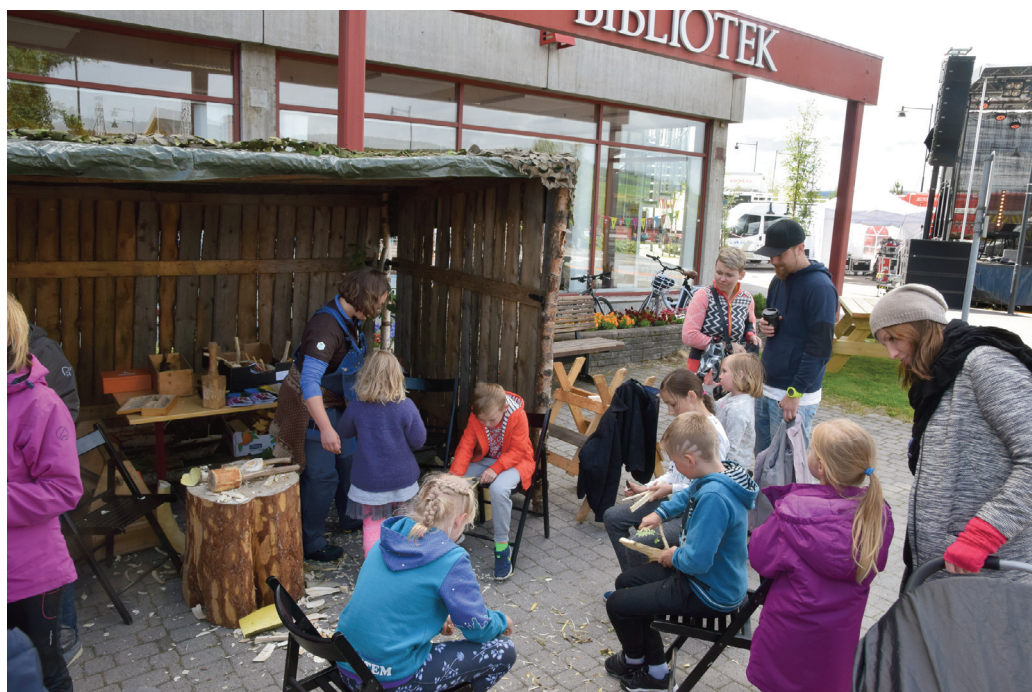
Spikking for Sommertoget ankommer Tynset Stasjon.