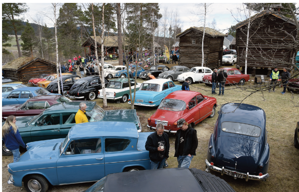
Vårmønstringa til Nord-Østerdal Motorhistorisk Forening i museumsparken får ut doninger og folk av alle slag.