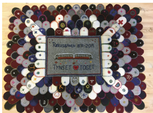
Hæltepedugnad. I anledning 140 års jubileet for Rørosbanen ble det arrangert en hæltepedugnad av Tynset Husflidslag og Musea i Nord-Østerdalen under Sommertoget på torget i Tynset. Dette ble overrakt Bane Nor på jubileumsdagen 13. oktober.

Det er stadig etterspørsel etter kurs fra ulike hold, og i høst valgte vi å lage «gotisk oktober» med fem kvelder fordypning i gotisk skrift. Dette går hånd i hanske med den økende interessen ute blant folk når det gjelder gransking av eldre dokumenter og skrifter, gjerne relatert til slekts- og gardshistorie.