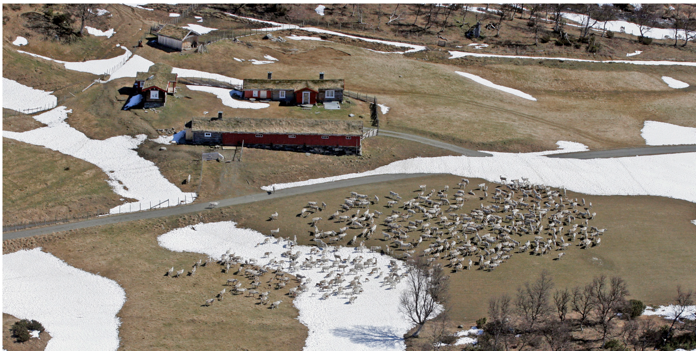
Godt vårbeite: Etter en lang vinter trekker villreinen gjerne inn på setervollene, som her på Spellmollen i Såttåhaugen. Bildet er fra 27. mai i 2006.