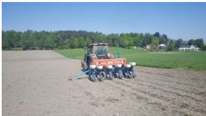
MAISSÅING PÅ BYGDØ.

Året 2018 ble preget av den rekordtørre sommeren. Grasavlingene ble halvert i forhold til et normalt år og flere dyr, storfe og sau, ble slaktet for å redusere forbruket av grovfôr. Mye av engarealet måtte brukes til beite etter førsteslåtten. Det ble lagt ned et betydelig arbeid i å sette opp gjerder og flytte dyr til de forskjellige arealene. Situasjonen gjorde det nødvendig å styrke satsingen på dyrevelferden. Gartneriet, hagebruket og det historiske landbruket ble også sterkt preget av tørken, og det ble gjort en stor