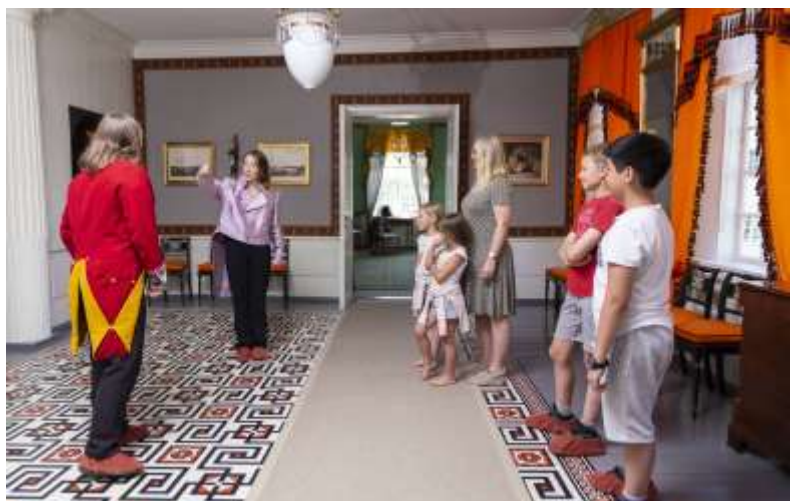
VANDRETEATER I EIDSVOLLSBYGNINGEN, SOM EN DEL AV SOMMER-TILBUDET «DET VAR EN GANG».

Året 2018 var svært aktivt, både den ordinære virksomheten og prosjekt-driften. Besøkstallene var gode, og takket være de store gratisarrangementene i mai og generelt godt besøk i høst, ble det en oppgang i samlet antall besøkende på 5 prosent. Hetebølgen i sommer førte til at antall solgte billetter sank med 2,5 prosent. USA-prosjektet «Founding Fathers across the Atlantic – History and Legacy in Norway and USA» ble lansert i november