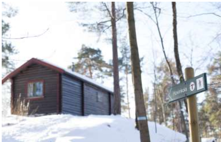
DNT-HYTTA HOVINKOIA PÅ NORSK FOLKEMUSEUM ÅPNET I 2018.