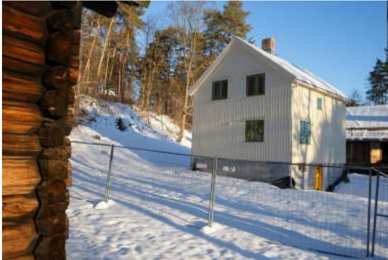
FINNMARKSHUSENE VED NORSK FOLKEMUSEUM.