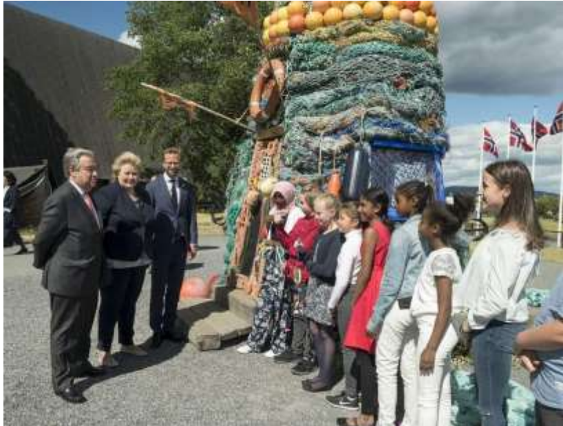
FNS GENERALSEKRETÆR ANTONIO GUTERRES, STATSMINISTER ERNA SOLBERG OG BISTANDS- OG UTVIKLINGSMINISTER NIKOLAI ASTRUP MØTER BARN FRA BRYN SKOLE. ANLEDNINGEN VAR MØTE I FNS HAVPANEL 19. JUNI 2018.