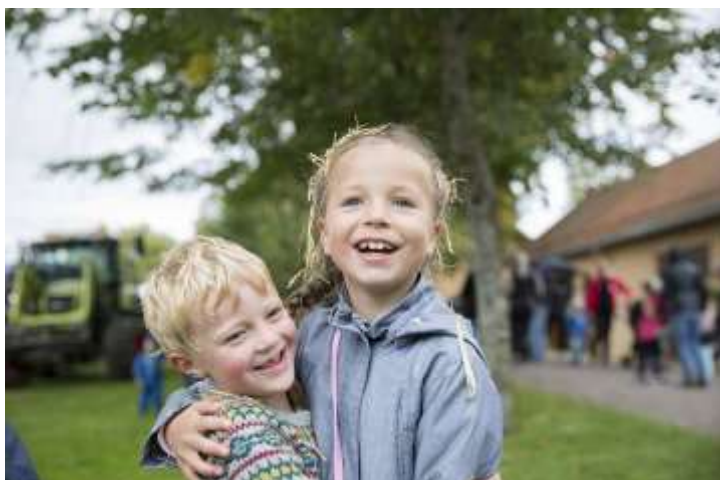
BESØKERE VED FAMILIEARRANGEMENTET HØSTDAG PÅ BOGSTAD GÅRD 2018.

Museet har vist to egenproduserte kulturhistoriske utstillinger i butikkarealet, og Galleri Bogstad har hatt 26 kunstutstillinger med totalt 50 kunstnere representert. Utstillingene i vognremissen og seletøykammeret er rehabilitert med frivillig hjelp i samarbeid med konserveringsavdelingen. Nettsidene er videreutviklet og det er tatt i bruk modul for billettsalg i forbindelse med familie-arrangementene. Det er arbeidet strategisk med sosiale medier og