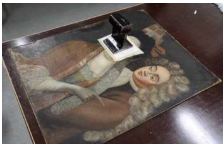
FØR OG UNDER KONSERVERING AV DOBBELTPORTRETT FRA RIKSSALEN, EIDSVOLLSBYGNINGEN

Hovedprosjektene ved konserveringen i 2018 var konservering av gjenstander og interiører, utstillingsplanlegging med prosjektlederne for Bybygg, Tidsrom, Båthall og Finnmark, vurdering og godkjenning av utstillings- og byggemateriale, tilrettelegging av gjenstander for gjenstandsutvalg, konservering og montering av interiører.