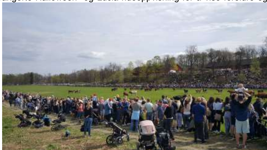
KUSLIPP PÅ BYGDØ KONGSGÅRD I 2018

Besøktunet på Bygdø Kongsgård har hatt lørdagsåpent for publikum fra mars til november. Det har vært organisert omvisninger for barnehager, skoler og andre grupper gjennom hele året. Gruppene som kommer på besøk får et innblikk i gårdsdriften basert på de forskjellige årstidene og arbeids-oppgavene på gården. Rideskolen har i løpet av 2018 økt fra 110 til 130 faste elever i uken. Vi arrangerte Halloween- og Lucia-rideoppvisning for å vise foreldre og publikum rideskolens aktiviteter. Det ble arrangert rideleir fire uker med åtte elever på hver leir. Rideskolen bidro også med runderidning på flere arrangementer og lørdager på Bygdø Kongsgård og på julemarkedene på Norsk Folkemuseum. Skogdagen ble avholdt i april med forskjellige