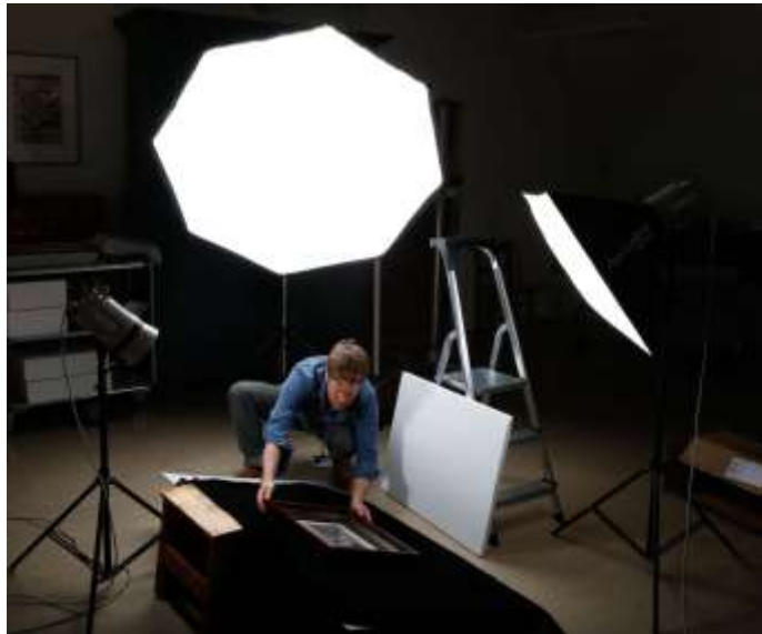
MUSEUMSFOTOGRAF HAAKON HARRIS SETTER OPP GJENSTAND FOR AVFOTOGRAFERING PÅ NORSK FOLKEMUSEUM.

Bildebyrået har hatt normal drift med interne og eksterne bestillinger, skanning, reprofotografering/digitalisering og printing av bilder til kunder. Man har også i løpet av året fastsatt nye priser for fototjenester som blir innført fra 1. jan 2019.