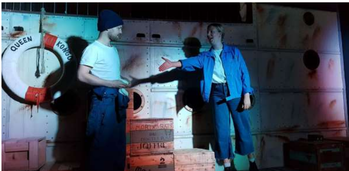
TEATERFORESTILLINGER FOR BARN VED UTSTILLINGEN PÅ REISE MED CHIEFEN OG SALLY JONES HAR VÆRT EN STOR SUKSESS PÅ NORSK MARITIMT MUSEUM.

Året startet med gjennomføring av DKS og opplegget ved Fyrtårnet for skoleåret 2017/2018. Her var totalt 600 elever med på utendørs workshop om søppel i verdenshavene.