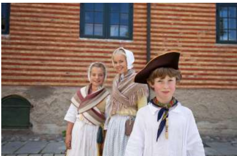
ELEVER PÅ SOMMERSKOLE VED NORSK FOLKEMUSEUM.

Styret konstaterer med bekymring at driften av NMM i 2018 måtte skje på bekostning av de øvrige delene av stiftelsen. En ytterligere nedskjæring av bemanningen ved Arkeologisk seksjon vil gjøre det vanskelig for seksjonen å utføre sine lovpålagte oppgaver og ivareta de kulturminner de er satt til å forvalte. Styret forventer at Staten ved økte bevilgninger bidrar til at Arkeologisk seksjon kan fortsette sin virksomhet som kulturminne-forvaltere og som et kraft- og kompetansesenter innen norsk marinearkeologi.