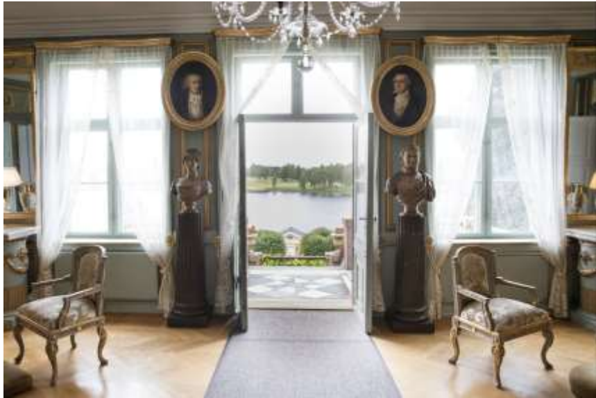
INTERIØRBILDE FRA BOGSTAD GÅRD.

Det er laget en overordnet vedlikeholdsplan for anlegget, og sikringsplan er utarbeidet. Været har vært krevende dette året. Etter en snørik vinter ble en stor mengde takstein revet ned eller skadet. Dette er utbedret. Samtidig ble den tette vegetasjonen rundt nordre låvebro til Maskinlåven ryddet for å gi bygningen mer luft og forebygge fuktskader.