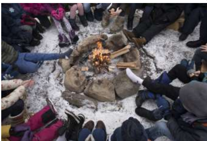
ELEVER FRA BYGDØ SKOLE VED DNT-HYTTE HOVINKOIA SOM ÅPNET PÅ NORSK FOLKEMUSEUM I 2018.

Antall åpne poster bemannet med tunverter i Friluftsmuseet varierte for vintersesong og sommersesong. I sommersesongen utvides tilbudet, og i høysesong var 13 steder åpne for de besøkende. Da styrkes publikumstilbudet ytterligere med to tunverter i arbeid innenfor historisk landbruk med skjøtsel i Friluftsmuseet, drift av fjøset i Elnanlåven og dyrehold med fokus på formidling. I lavsesong er arbeidet konsentrert rundt fjøset og driftsform fra 1950-tallet. Fjøset er da bemannet med en tunvert på lørdager og søndager. Nytt av året var bemanning av Ampiansbråten og Saga-stua i