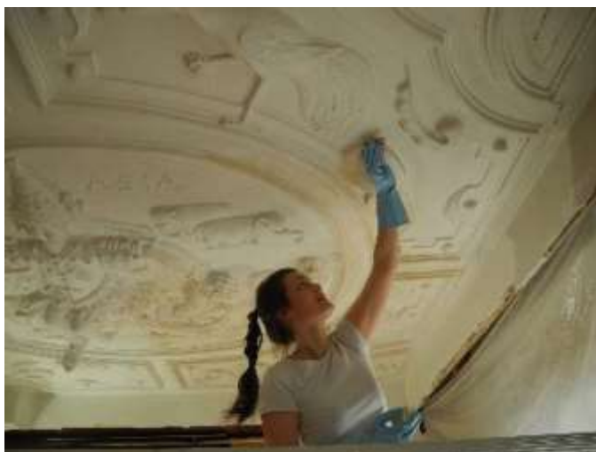
RENSING AV GIPSTAKET «DE 4 VERDENSDALER», DATERT 1662, INNFOR UTSTILLINGEN TIDSRUM PÅ NORSK FOLKEMUSEUM.

Forvaltningen av Sentralmagasinet har hatt redusert kapasitet på grunn av vakanse i stillingen som magasinforvalter i 2018. Uavhengig av dette har det kontinuerlig foregått magasinering med fast plassering og uttak til besøk/utlån. Magasinet har hatt 40 eksterne besøk og 250 gjenstander er tatt ut av magasin/utstillinger for studier. Bååstede-prosjektet har medført jevnlig besøk i hele 2018. I 2018 har 6698 objekter fått ny fast plassering i magasin/permanent utstilling i Stiftelsen. 21 utlån er administrert i 2018, 12 er forlengelse av gamle utlån, 7 kortidsutlån tilbakelevert.