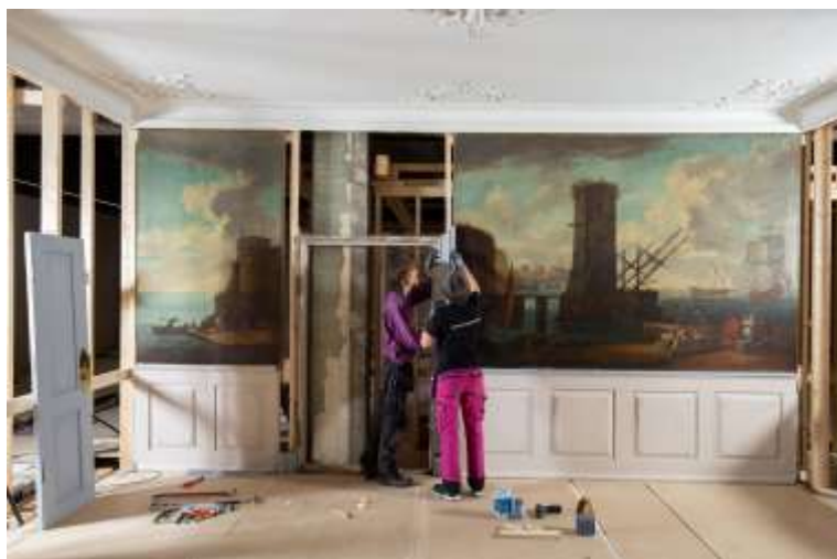
ARBEID MED INTERIØRER FOR UTSTILLINGEN TIDSRUM SOM ÅPNER PÅ NORSK FOLKEMUSEUM I 2020.

Konserveringsavdelingen er en fellesavdeling i Stiftelsen Norsk Folkemuseum med ansvar for at det konserveringsfaglige arbeidet i alle stiftelsens enheter utføres i samsvar med felles rutiner. Ut fra de ulike avdelingenes årsplaner lager konservering en prioritert plan for året. Stiftelsens hovedprosjekter er styrende for avdelingens planer. Avdelingen har 9 faste årsverk og i 2018 hadde vi støtte av flere prosjektansatte til sammen 8 årsverk fordelt på