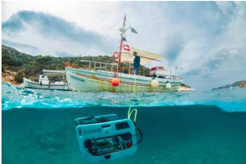
FRA PROSJEKTET UNDERWATER SURVEY OF THE SOUTH COAST OF NAXOS.

2018 har både vært et krevende og et godt år for Norsk Maritimt Museum (NMM). Krevende særlig fordi museet på grunn av nedgang i marinarkeologiske oppdrag måtte nedbemanne med to faste stillinger. Men 2018 har også vært et godt år med framgang på mange områder. Museet har arbeidet aktivt med tiltak for å styrke egeninntjening og publikumstilbudet. Dette har resultert i en fin besøksøkning på 7 % til tross for rekordvarm sommer. Museet kan vise til gode forskningsresultater og aktiv forskningsformidling gjennom publikasjoner, foredrag og i media.