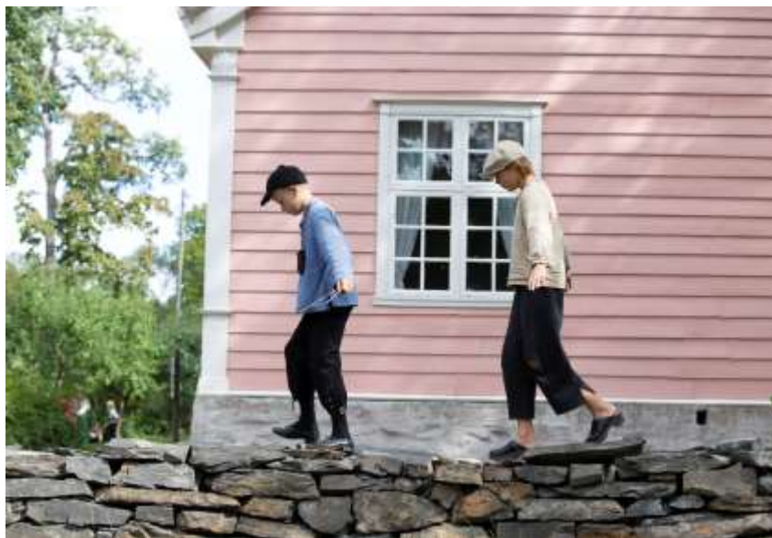
ELEVER VED SOMMERSKOLE PÅ NORSK FOLKEMUSEUM.

Friluftsliv har vært hovedtema for mye av Folkemuseets aktiviteter i 2018. I anledning Den Norske Turistforenings 150-årsjubileum åpnet DNT-hytta Hovinkoia i Friluftsmuseet. Gjennom året var det flere publikumsarrangementer, og hytta var bemannet av frivillige fra DNT. Med ei turisthytte kan museet formidle nordmenns forkjærlighet for hytteliv og turgåing. Også på andre fronter var det stor aktivitet gjennom 2018