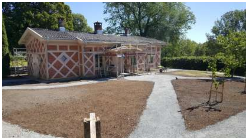
SISTE FINPUSS PÅ GARTNERBOLIGEN OG UTEOMRÅDE.

Avdelingens hovedarbeidsområde er å drive gårdsbruket på Bygdø Kongsgård. Gården disponerer 806 dekar dyrket mark. 761 dekar er eget areal på Bygdø Kongsgård og Friluftsmuseet mens de resterende 45 dekar er leid av Oslo kommune. Melkeproduksjonen leverte i 2018 322.866 liter økologisk melk til TINE som