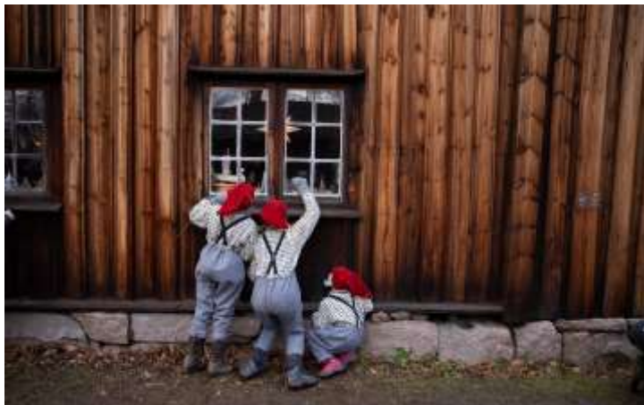
RAMPENISSER PÅ NORSK FOLKEMUSEUMS JULEMARKED 2018.

I 2018 var det 45 dager med publikumsarrangementer, de største var Julemarkedet, påsken og Sankthans. Utvidet åpningstid på Julemarkedet og et nytt nissekonsept i Østlandstunet førte til mindre køer og en bedre fordeling av publikum ute i Friluftsmuseet. Samarbeid med politiet har ført til bedre flyt i trafikkavviklingen og redusert køene til julemarkedet.