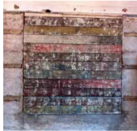
«Plankekunst». Dette feltet dukket frem under riving og skal stilles ut i garderoben som en del av fortellingen om byggets historie.