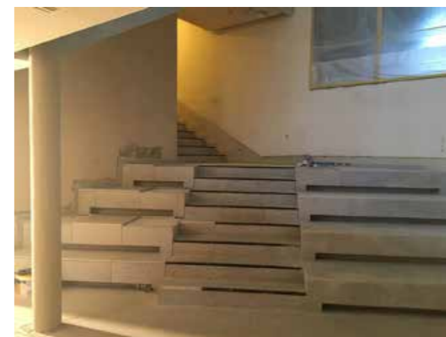
Trapp og amfi i vestibylen. Terrasso støpes og legges.