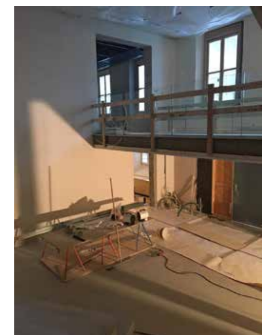
Gangbroen forbinder utstillingens første etasje.