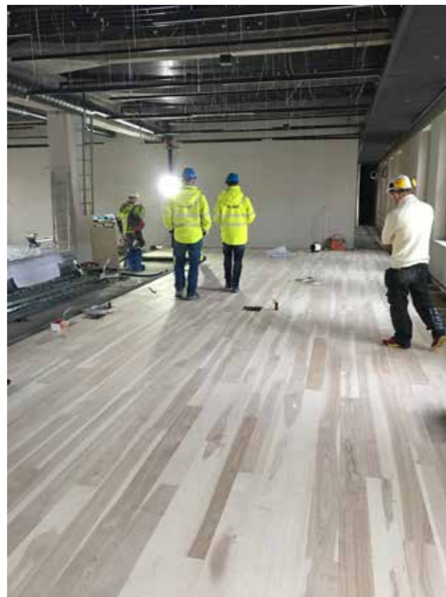
Askegulvet ferdig lagt.