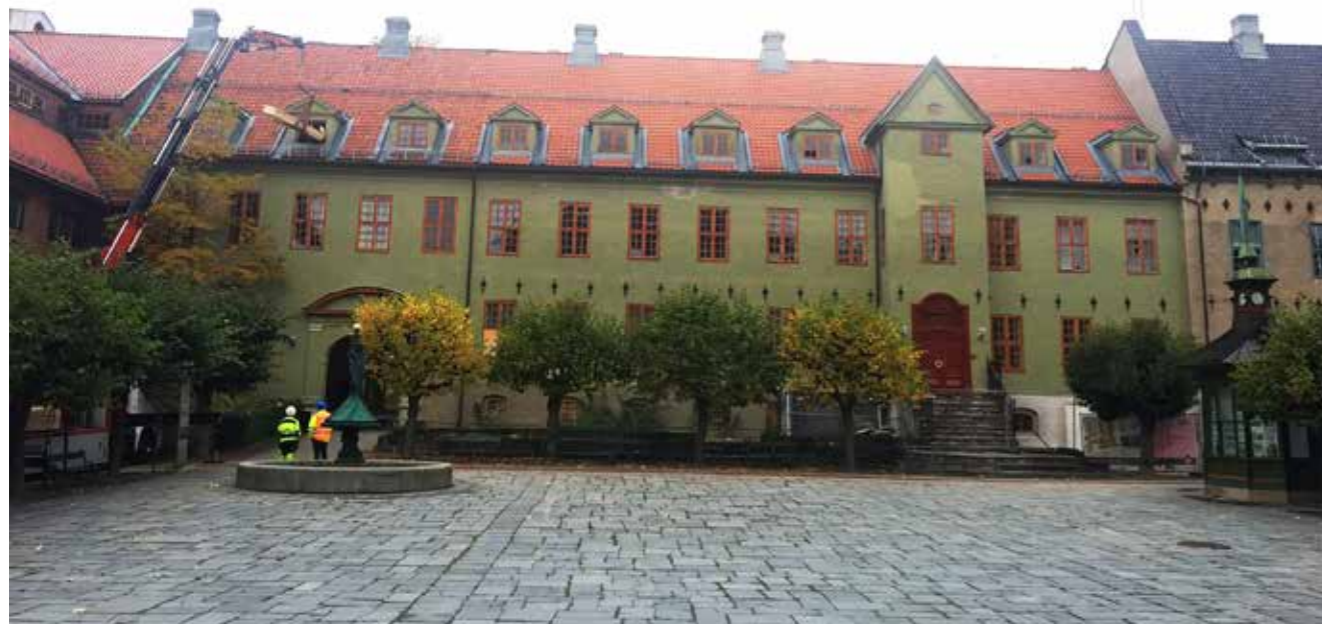
Bybyggs fasade. Den nye inngangen kommer på bakkeplan til høyre for den gamle inngangen. Til venstre ses en av flere kreative løsninger for å få materialer inn i bygget.

Nå nærmer byggeprosessen seg ferdigstilling og selve utstillingsproduksjonen kan begynne. Det gleder vi oss til!