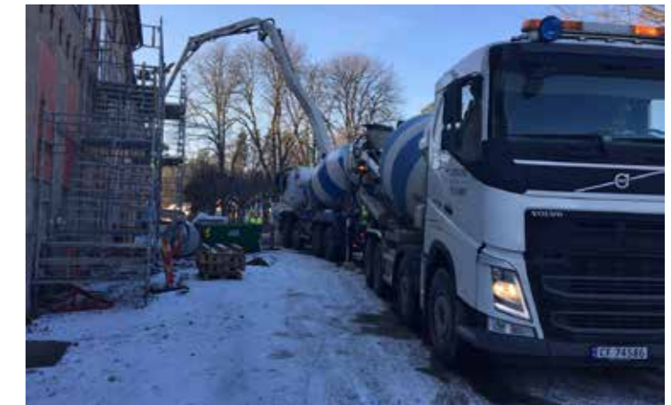
Betongbilene gikk i skytteltrafikk. Det må til når et hundre år gammelt betongbygg skal rehabiliteres.