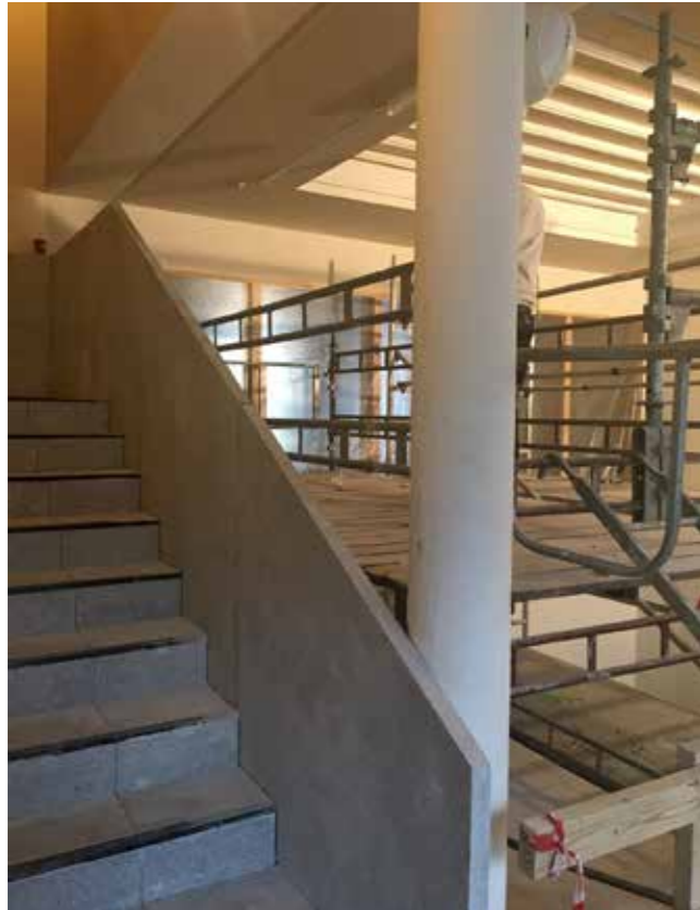
Vestibylen tar form. Til venstre ses trapp opp til annen etasje. Trappen går rundt heishuset.