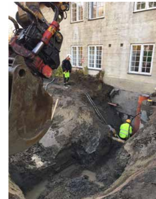
Rør skal frem, også på utsiden.