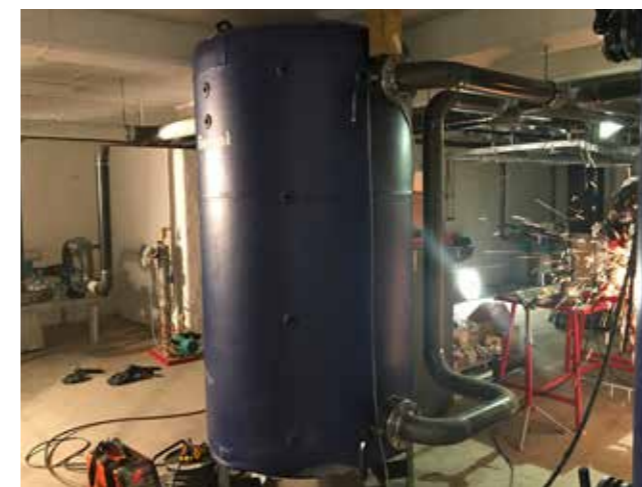
Det er ikke lite som skal til av tekniske installasjoner. Her fra pumperommet for jordvarmen.