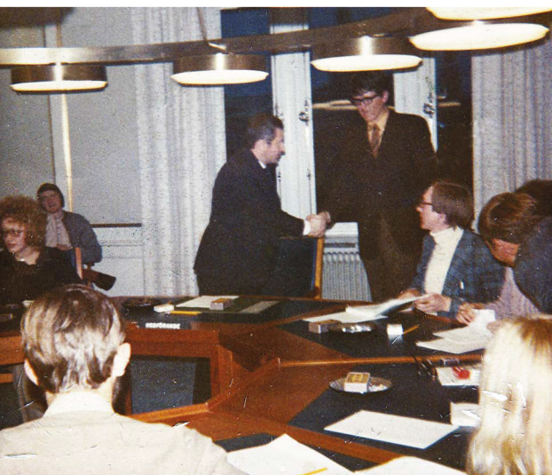
Den svenske finansministeren, Kjell Olof Feldt, møtte klassen og holdt en times foredrag om Sveriges økonomi.

Gjesteforeleserne brakte elevene i nærkontakt med det pulserende liv, i enda høyere grad gjaldt det ekskursjonene. Elevene fikk her en mengde informasjon som de ikke ville ha muligheter for å skaffe seg i et klasserom. Men skulle ekskursjonene lykkes, var forberedelsene grundige og etterarbeidet i grupper tok også en del tid. Resultatene ble lagt frem i form av en rapport. Gruppearbeid som arbeidsform kom virkelig her til sin rett. Årsakene til det synes klare. Elevene var engasjerte, de hadde hatt en felles opplevelse som alle kunne være med å drøfte. Det faglige utbyttet syntes også å bli større fordi elevene her fikk sammenligne sine erfaringer og gjensidig hjelpe hverandre med å finne svar på problemene.