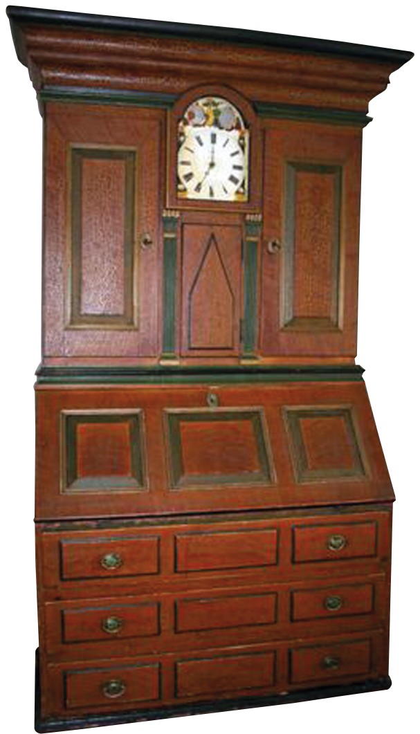
Skatoll Nr 74, med klokke.