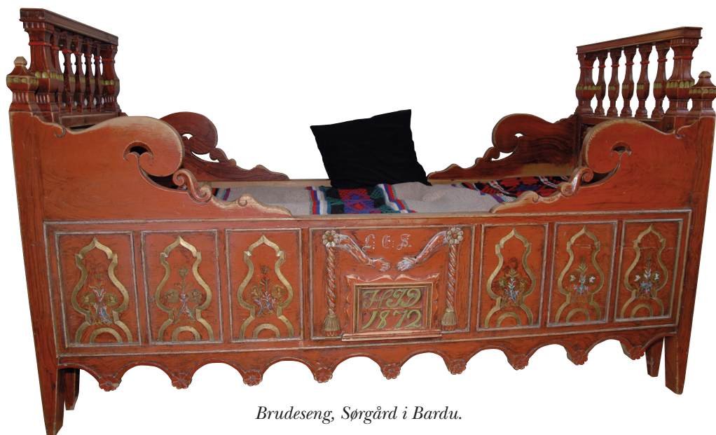
Brudeseng, Sør-gård i Bardu.