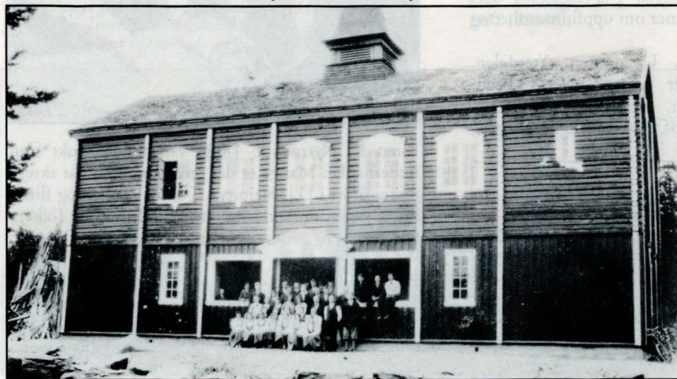
Ungdomslaget foran huset sitt. (24451).

eit stort løft, krevde mykje både av pengar og dugnadsarbeid. Med eldsjelene og føregangsmennene fantest, så hus vart bygde rundt om i grend og bygd.