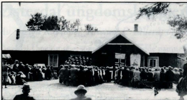
Frå stemnet i Dalsbygda i 1939 (31060).

Det siste stemnet i Østerdal Ungdomslag var på Dalholen i 1971.