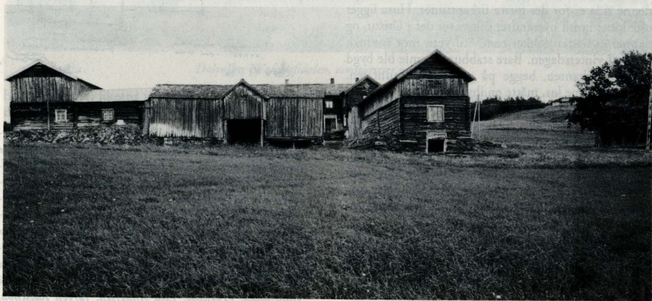
Husm i Alvdal Utistu, Dalsbygda, Os. Garden ble bygd opp omkring 1850.