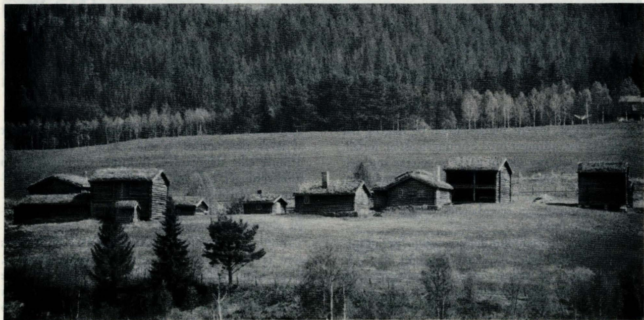
Nordre Husan, Alvdal. Bygd før 1800. Gardsanlegget består av 17 hus.