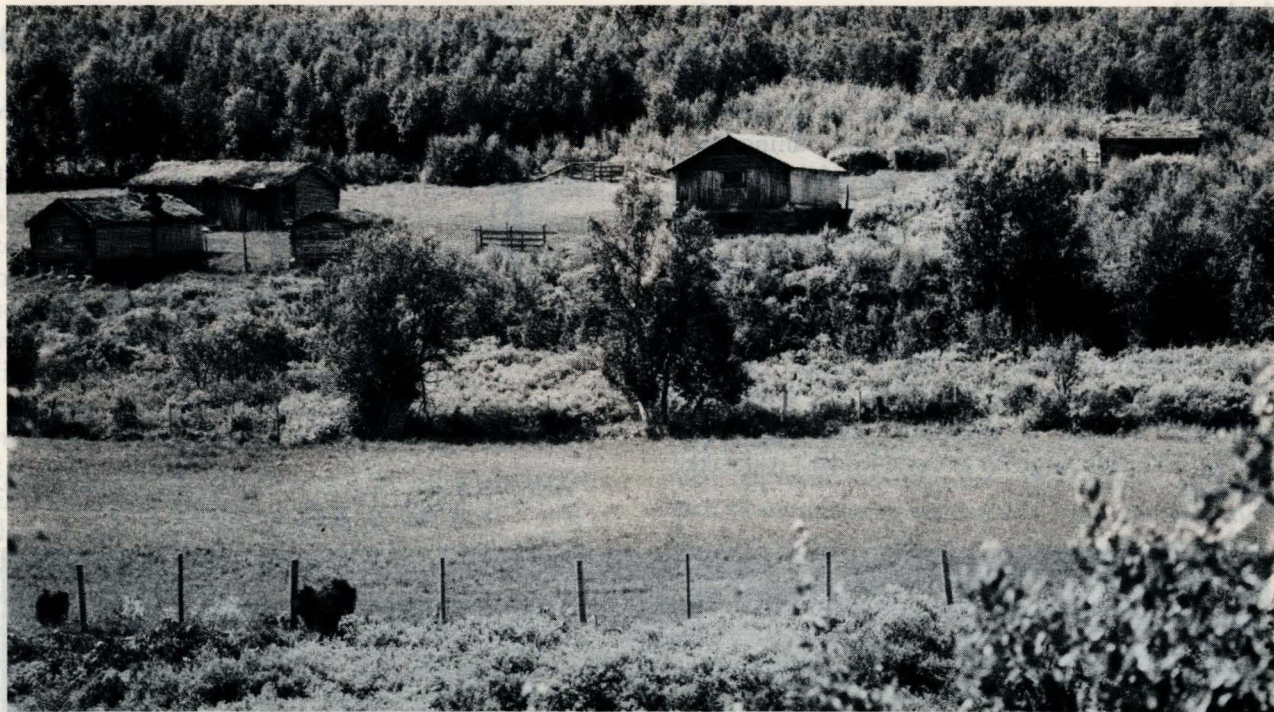
Dalvollen i Vangrøftdalen, sommerseter under Utistu.

hørt for lengst, likeens markaslåtten, og følgelig har det skjedd forandringer med bygningsmassen: forfall, ombygging, salg osv. Utistu har ei av setrene sine helt intakt, på Dalvollen i Vangrøftdalen. Seteranlegget, med hus og landskap, viser god, tradisjonell byggeskikk og demonstrerer seterdalenes viktige rolle i et ekstensivt jordbruk.