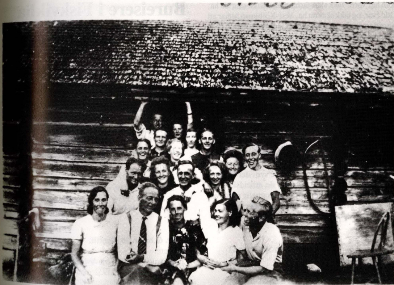
Sammenkomst på Fiskvikrokkdalen.