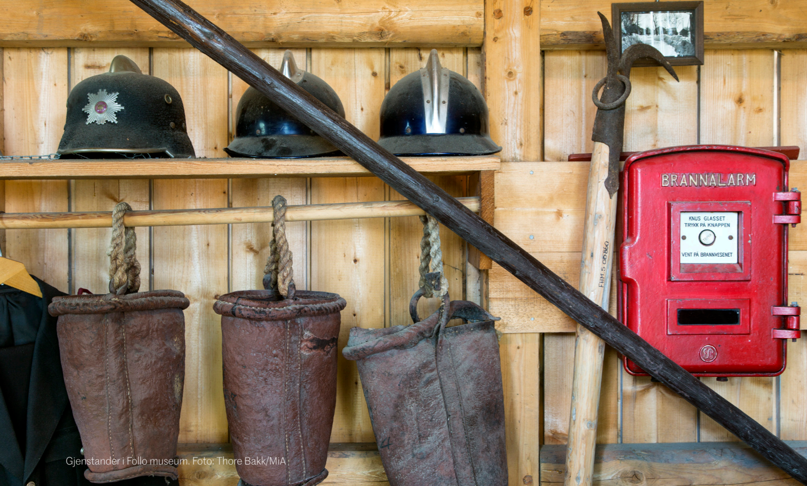
Gjenstander i Follo museum.