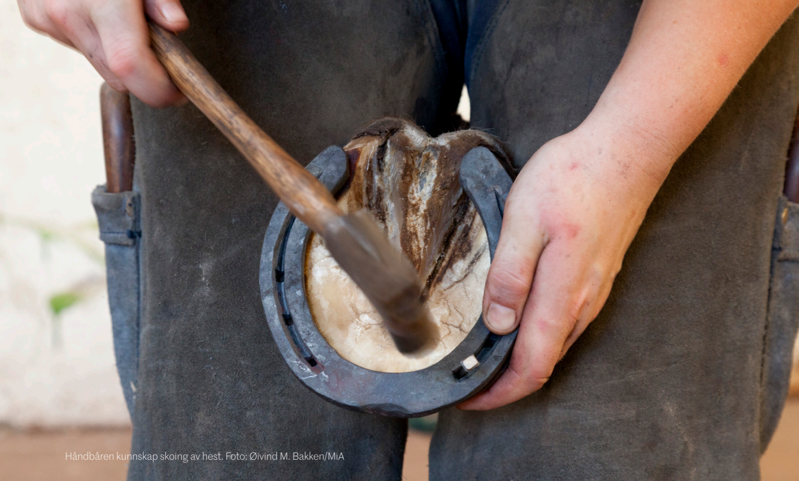
Håndbåren kunnskap skoing av hest.