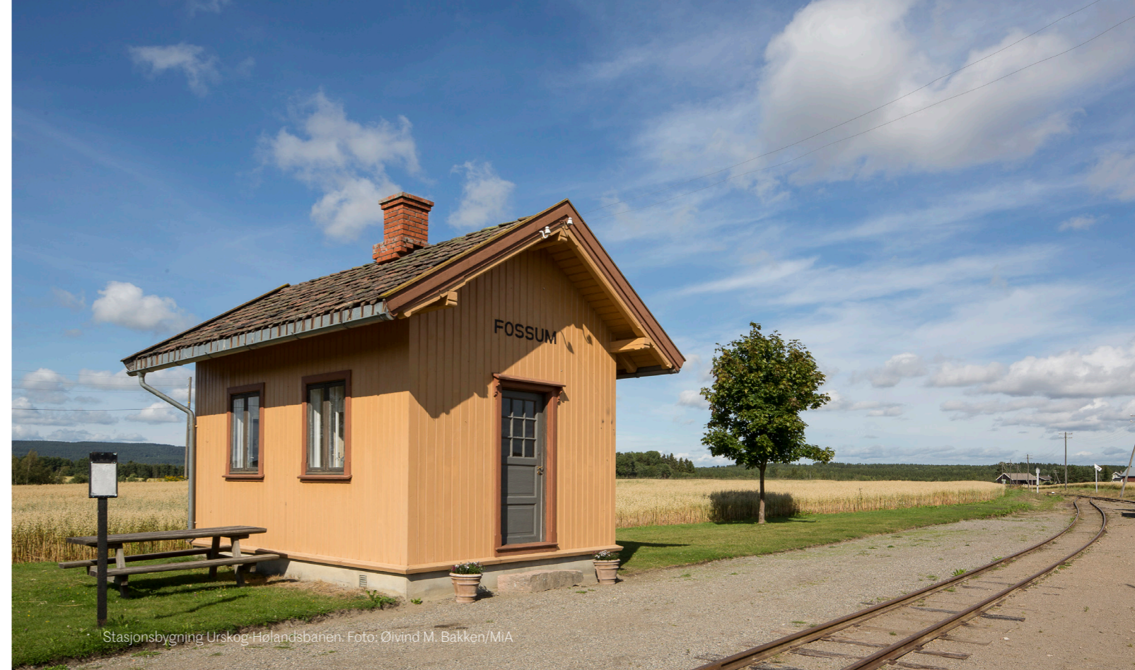
Stasjonsbygning Urskog-Hølandsbanen.

Oppbygge eldre plantesamling ved Linderud gård med utgangspunkt i fotografier og spor av bedplasseringer i anlegget.