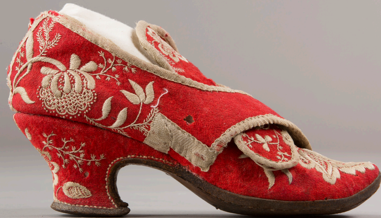
Brudesko 1700-tallet Gamle Hvam museum.