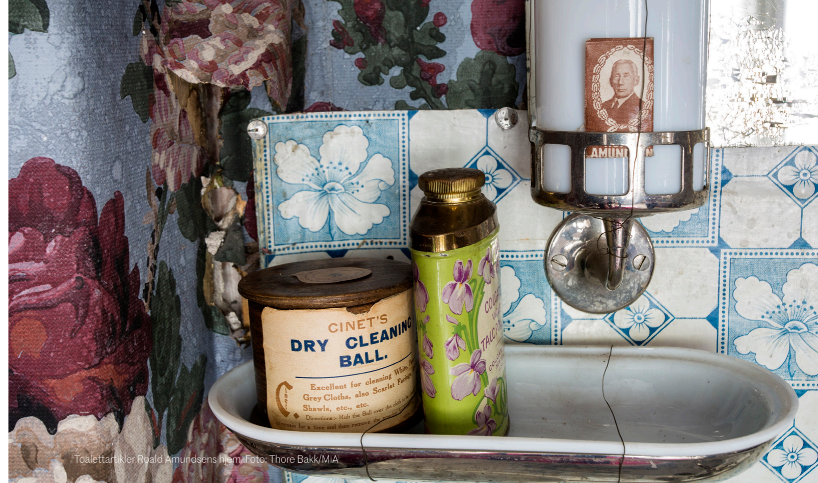
Toilettartikler Roald Amundsens hjem.