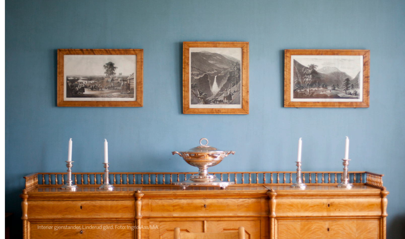
Interiør gjenstander, Linderud gård.