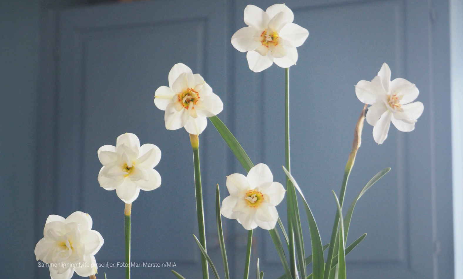
Sammenligning fylte påseliljer.