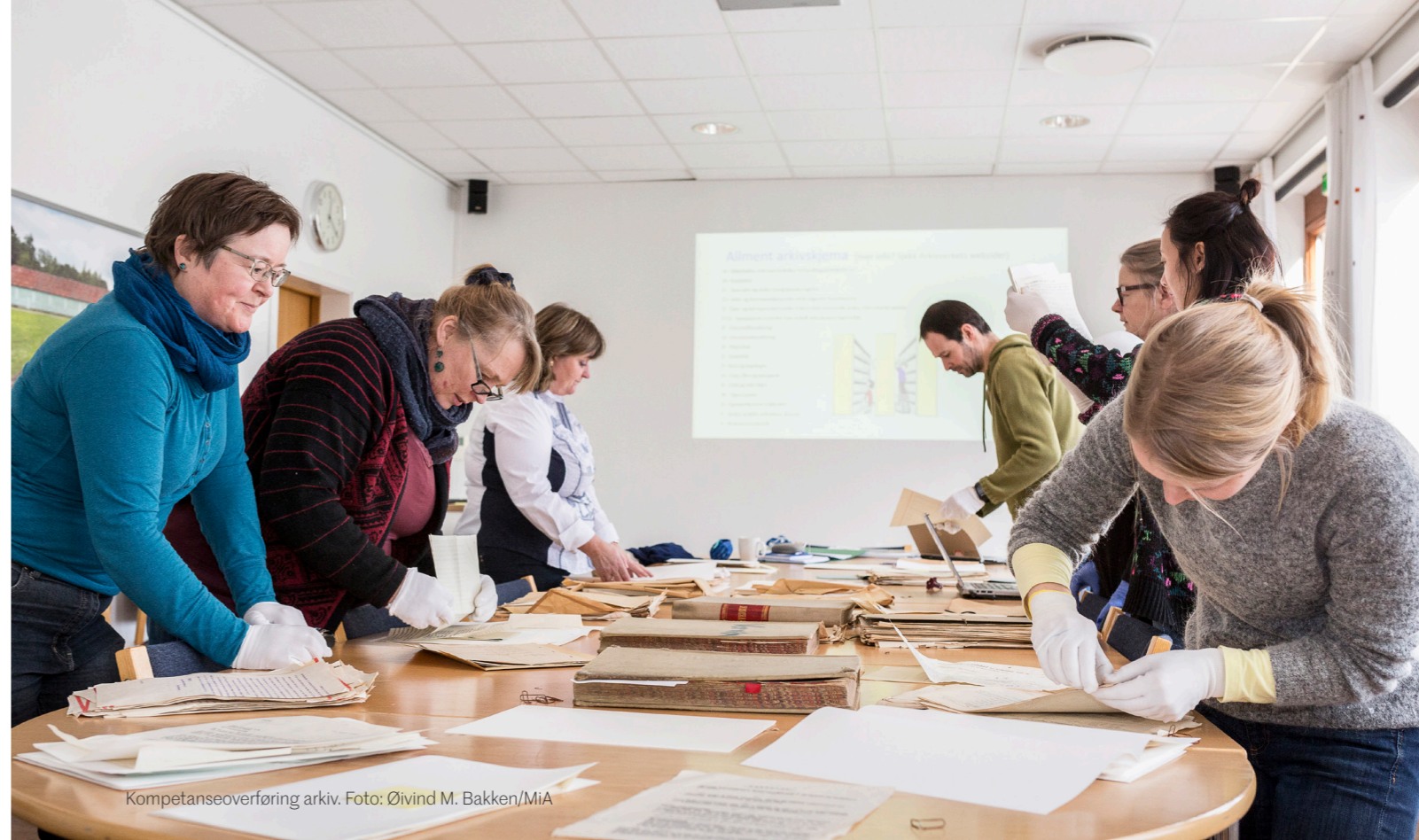
Kompetanseoverføring arkiv.

Stiftelsens styre kan, etter anbefaling fra lokale eiere og fra stiftelsens faglige ansvarlige, treffe beslutninger om deponering.