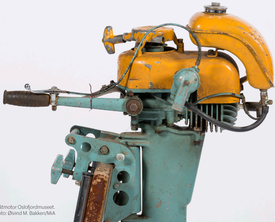
Båtmotor Oslofjordmuseet.