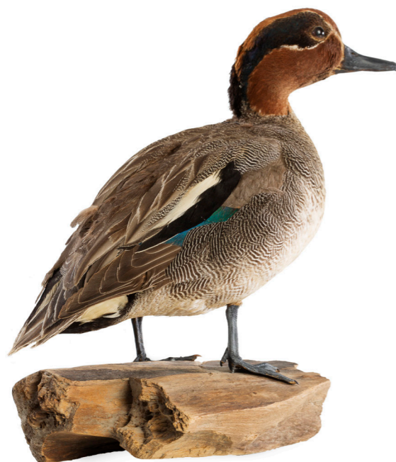
Utstoppet krikand, NØBV.