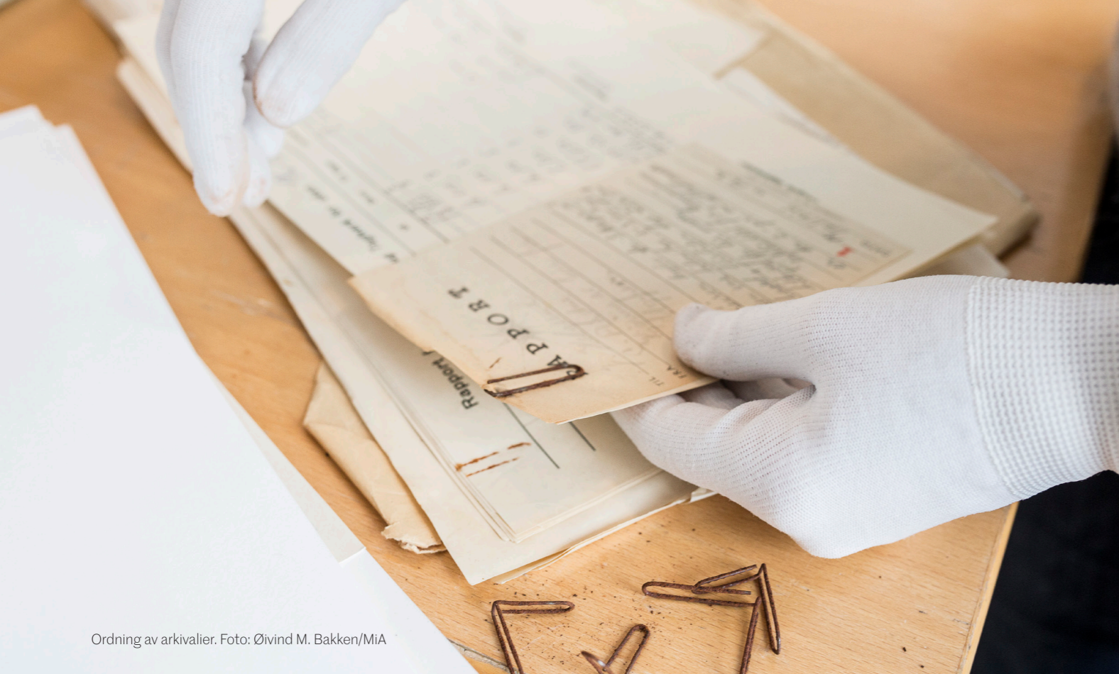
Ordning av arkivalier.