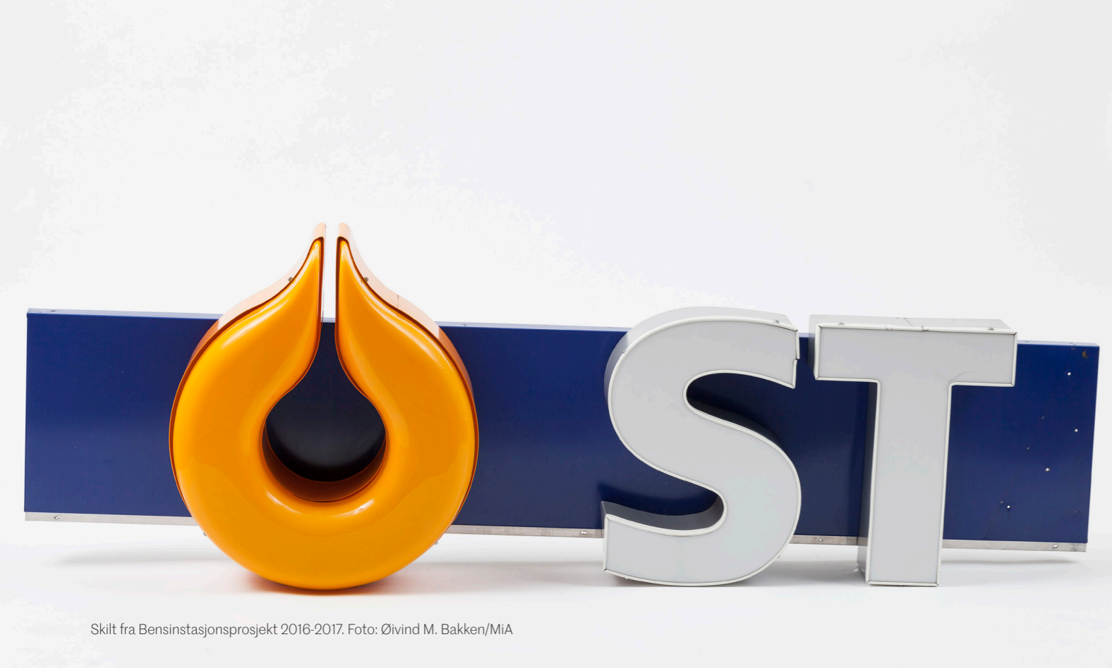
Skilt fra Bensinstasjonsprosjekt 2016-2017.