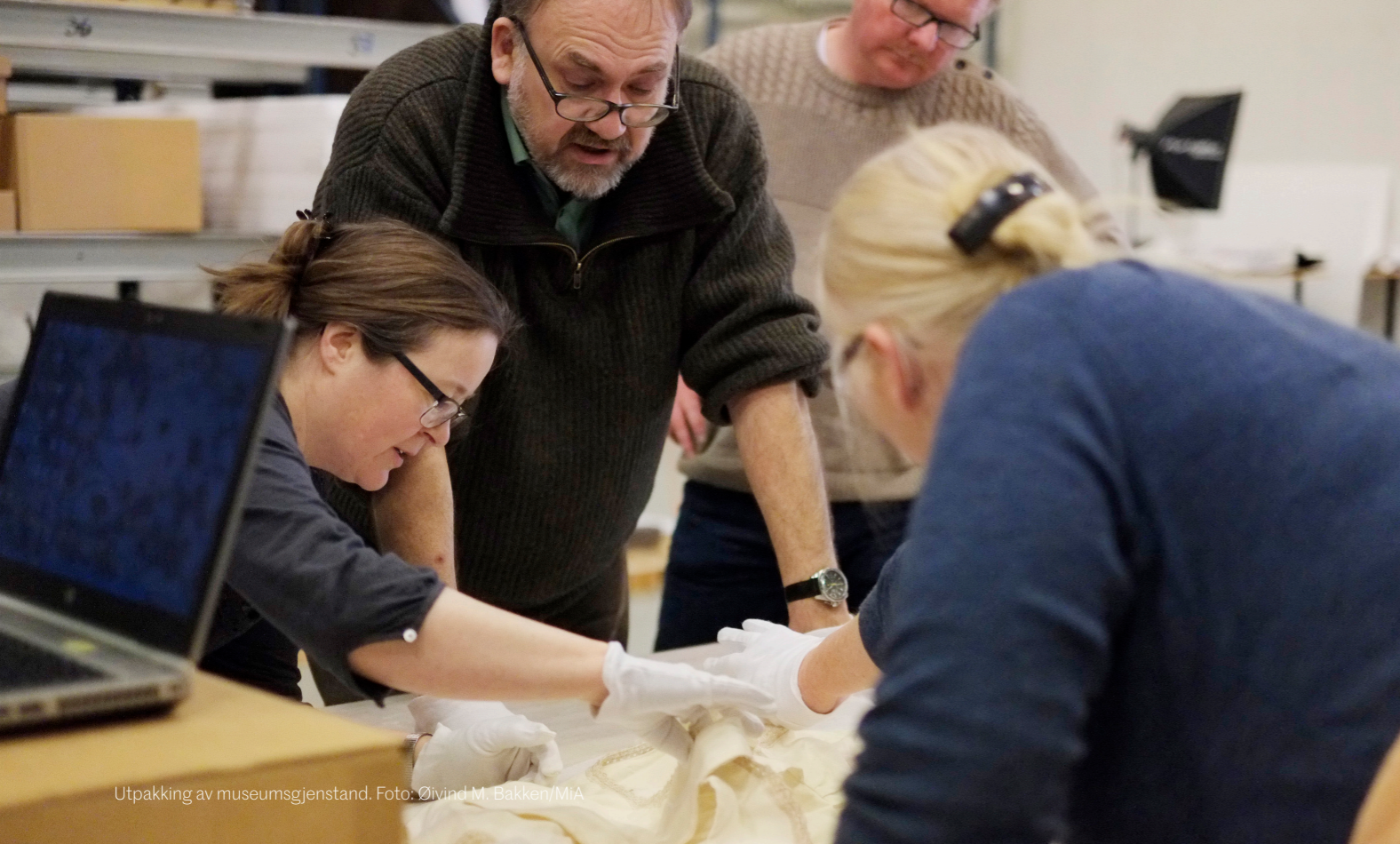
Utpakking av museumsgjenstand.