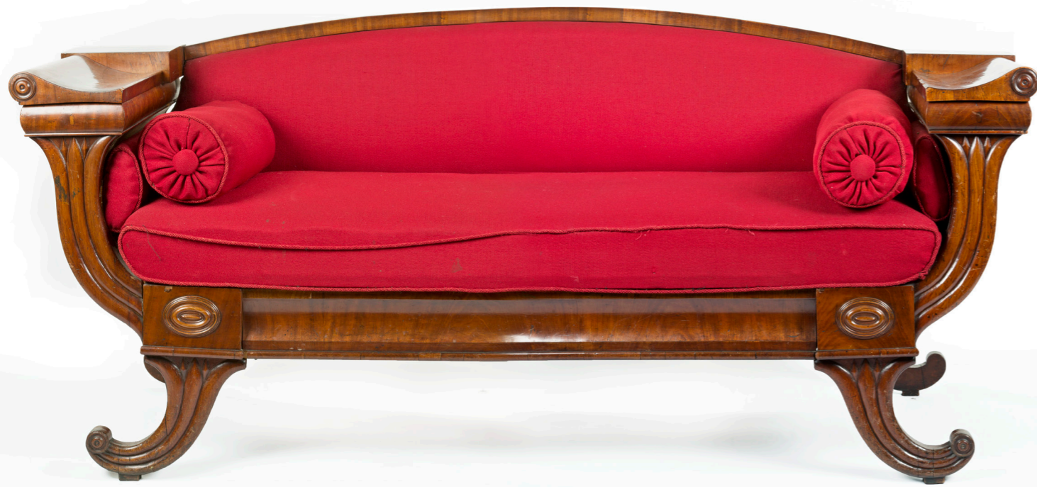
Biedermeier sofa 1800-tallet Asker Museum.