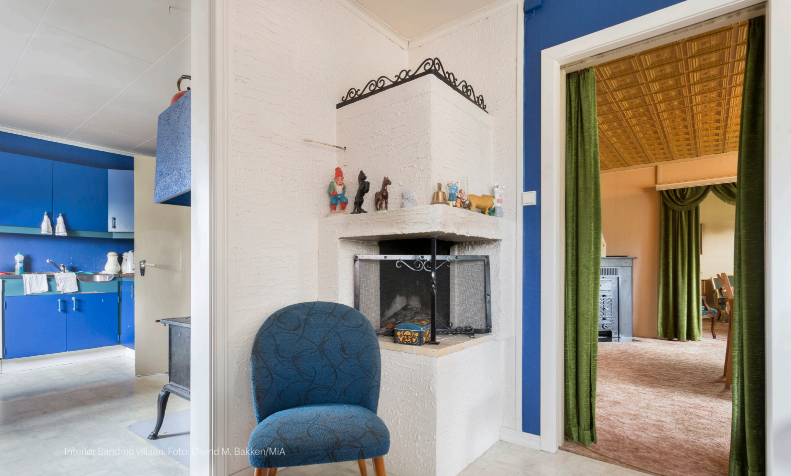
Interiør Sandmo villaen.