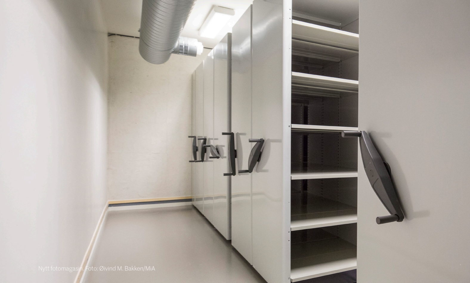
Nytt fotomagasin.