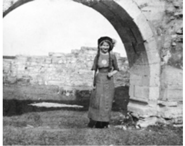
KIRSTEN I RUINENE: Kirsten Flagstad var bare noen måneder da familien flyttet fra Hamar, men hun var nært knyttet til Strandstuen og Hamar også i ungdomsårene. Dette bildet er fra et besøk i 1911, da hun blant annet besøkte domkirkeruinene.