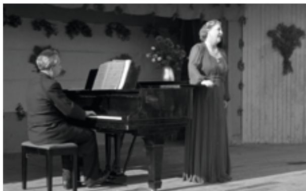
UTENDØRSKONSERT: Det var vært en del sagnomsuste utendørskonsert i Hamar, dette er fra Kirsten Flagstads flotte konsert på Domkirkeodden i august 1953.