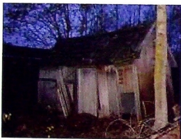
Bygget var hardt angrepet av råte Og bar preg av å ha stått uten tilsyn i lang tid.

Alternativet til fjerning, var restaurering eller rivning. Heldigvis tok kommunen kontakt med oss. Vi fikk dermed muligheten til å redde dette bygget som trolig er den siste originale bygningen av sitt slag fra driftstiden. Etter en befaring i 2006, startet i 2007 det nøysommelige arbeidet med demontering og flytting. En jobb som først medførte trefelling og generell rydding. Priveten var mer eller mindre inngrodd. Etter litt arbeid som skogsarbeidere, var det tid for demontering.