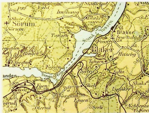
Sørumsand stasjon med UHB og Kongsvingerbanen 1907

Urskog-Hølandsbanens Medlemsblad, nr. 126, sept. 2012, ISSN 1503-4135