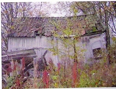
Privet med uthus slik det så ut på Mork i 2006.

I 1896 var tiden inne. To slanger av jern lå klare og buktet seg gjennom landskapet og gjorde det mulig for Tertitten og puste seg gjennom åker og eng. Men det var ikke liv laga for en bane som Tertitten uten stasjoner og stoppesteder, og en av disse var Mork. Her stod det en gang en utedo, og ikke en hvilken som helst utedo. En "utedo deluxe", med innlagt strøm, plass til flere av gangen, eget påbygg/uthus og egen fuglekasse. Ja, tro det eller ei. Den hadde pinade meg eget grisehus som påbygg en stund! Riktig nok startet den sitt liv som en hvilken som helst utedo. Deluxe-utgave ble den trolig først da Mork fikk egen stasjonsmesterbolig på midten av 30-tallet.