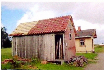
Priveten slik den står i skrivende stund. Det begynner sakte, men sikkert å likne på noe.

Vi har igjen en del arbeid etter takstein. Det må jo på gesims og vindskier blant annet. Og fortsatt mangler også to av dørene. Den ene av dem står, nesten ferdig, i treverkstedet i lokstallen på Sørumsand. Den andre står i og for seg der den også, men den gjenstår det mye jobb på.