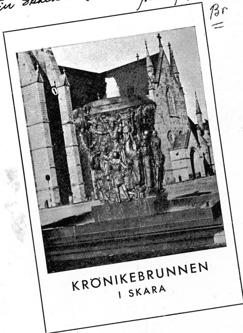
KRÖNIKEBRUNNEN I SKARA

Den Skara stifts- o. landskapsleksikon från förf.