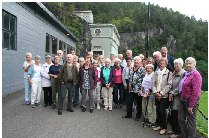
En fornøyd gjeng!