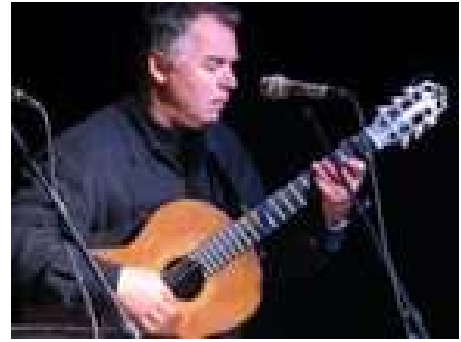
Frå ein tidlegare konsert i Rallarens rike

Lørdag 22. mai er det igjen den tradisjonelle konserten i Tysso I. Utøverne i år er Martin Fröst på klarinett med kammerorkesteret Ensemble Allergria. Fröst er ein av verdas beste klarinettistar.