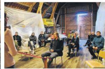
FORSAMLING: Gjестene som var på åpningen satt med god avstand til hverandre på låven.