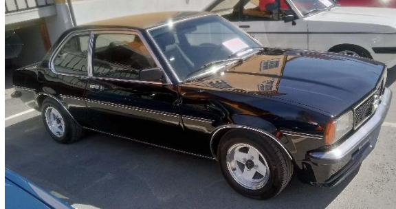
Veteranbilutstilling i Brandbu mai 2018.

Det er i den uorganiserte tiden, livet utenfor de voksnes og institusjonenes kontroll, ungdomskulturer og frihet til «å teste grenser» fins. Lite er så identitetsskapende som subkulturene blant ungdom. Dette vises særlig ved identitetsproklamerende klesstil og symbolbruk. Her ligger det en utfordring for museet for å dokumentere mangfoldet og personlige historier som kan speile regionens diversitet i befolkningen. Disse «uorganiserte» miljøene er lite dokumentert i Randsfjordregionen. Regionen har for eksempel musikkmiljøer og rånermiljøer.