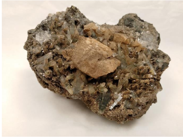
Stuff fra tunnelsamlingene på Hadeland Bergverksmuseum

I tillegg til mangel på fysisk, tilfredsstillende plass så har Randsfjordmuseet hatt behov for å skaffe en god oversikt over hva som finnes i egne samlinger, nettopp for å kunne vite hva det er behov for å samle i framtiden. Dette arbeidet har kommet langt på vei, og man har nå en relativt god oversikt over samlingene. Utfordringen ligger i at museets samling er registrert i ulike databaser, noe som stammer fra tiden før konsolideringen. Det er også en del av det registrerte materialet som ikke er lagt inn i databasen, men kun finne registrert i protokoll eller kortkartotek. Dette fører til at medarbeidere, som arbeider ved ulike formidlingssteder, ikke har mulighet til å søke i Randsfjordmuseets komplette samlinger. Dette er generelt problematisk i forbindelse med samlingsutvikling, og spesielt i forbindelse med vurdering av prioritering, da det er nærmest umulig å få full oversikt samlingene. Da Randsfjordmuseet valgte å inngå driftsavtale med MuseumsIT i 2017 fikk museet sin første felles serverløsning. Dette åpnet for en sammenslåing av de digitale samlingsdatabasene. Dette vil bli foretatt høsten 2018 for å sikre en bedre samlingsforvaltning og -utvikling.