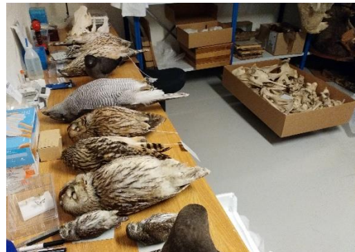
Registrering av fallvilt og annet naturhistorisk materiale foregår på Lands museum.

Museet har fritak fra fallviltforskriften § 8 om registrering og merking av vilt. 8 I utgangspunktet eier Viltfondet, dvs staten, alt vilt som ikke er jaktutbytte. Men museet har tillatelse til, som følge av fritaket, å overta fallvilt. Døde dyr som er knyttet til funn og kollisjoner med kjøretøyer, vinduer, kraftledninger og lignende kan gis museet fra privatpersoner uten at vedkommende finner har noen ervervet eiendomsrett. Gjennom museets fritak fra denne forskrift har museet forpliktet seg til å ha en fullstendig oversikt over sine samlinger i et eget digitalt system til enhver tid.