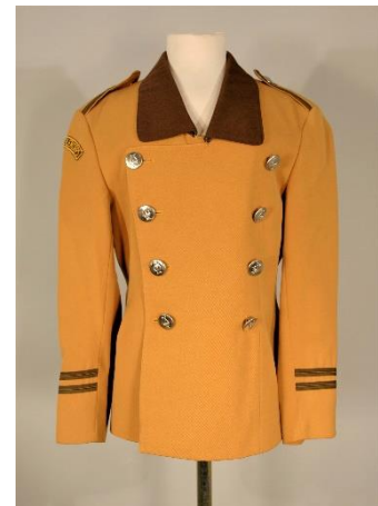
Korpsuniform fra Lands museum. Uniformen er sydd på K. Stormark konfeksjonsfabrikk.

Gjenstandssamlingen i Randsfjordmuseet omfatter flere delsamlinger. Tidsdybden i de ulike samlingene varierer, dog med en generell hovedvekt på perioden 1750-1960. Delsamlinger av en viss størrelse og med stort spenn i datering er blant annet drakt og tekstil samling, keramikk og glass samling, håndverk samling og våpen samling. Andre større delsamlinger har ulik grad av representativitet i tid, herunder samlinger knyttet til møbel og løst inventar, husflid, landbruksredskap og -maskiner, frakt og transport, småskalaindustri (inkludert bergverk), visuell kunst, handel og servicenæringer, idretts- og fritidsaktivitet med flere. Utover de større delsamlingene finnes flere proveniensskapte spesialsamlinger med alt fra etnografika og kuriosa, til julepynt og pokal- og medaljesamlinger. Enkelte av interiørene i bygningssamlingene har også en spesiell status, slik som Aadnes samlingene i Thomlebygningen. Samlingene defineres ikke i dag utfra klassetilhørighet, tilknytning til kjønn eller religion.