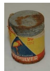
Bakepulverbokser med skader.