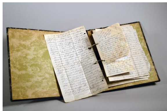
Amerikabrev som er kommet inn til Amerikabrev prosjektet.

Prosjektet fokuserer på brev fra et kulturelt og økonomisk homogent samfunn, med utgangspunkt i en samling Amerikabrev sendt mellom landinger i Amerika og Norge fra 1860-årene og opp til nyere tid. Det empiriske grunnlaget er basert både på eksisterende samlingsmateriale og på innsamling av brev. En del av det innsamlede materialet gis i gave til museets samling, noe gis som digital kopi. Innsamlingen sluttføres i 2018 med påfølgende analyse og publisering av resultatene. Ved prosjektslutt vil materialet bli innlemmet i samlingene som et privatarkiv.