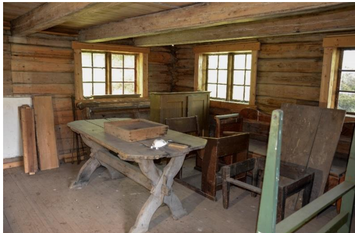
Prestkvern bygningen på Hadeland Folkemuseum ble avviklet som gjenstandslager høsten 2018. De fleste gjenstandene ble allokert. 21 gjenstander ble vedtatt avhendet eller kassert.

I 2015 publiserte Norsk Kulturråd «Retningslinjer for avhending». Retningslinjene ble utarbeidet i et samarbeidsprosjekt mellom Bymuseet i Bergen, Oslo museum og Randsfjordmuseene. Forslaget til retningslinjer er en praktisk forlenging av ICOMs museumsetiske regelverk og Spectrum. Randsfjordmuseet følger disse retningslinjene i tillegg til prosedyrene i Spectrum. For privatarkiv er det noe andre retningslinjer, selv om de ikke er underlagt Arkivloven med forskrift om avlevering, kassasjon og arkivdanning. Når et privatarkiv blir avlevert Randsfjordmuseet må arkivskaper, eventuelt den som eier arkivet, signere på en avtale om de godtar at det foretas kassasjon etter Randsfjordmuseets kassasjonsrutiner.