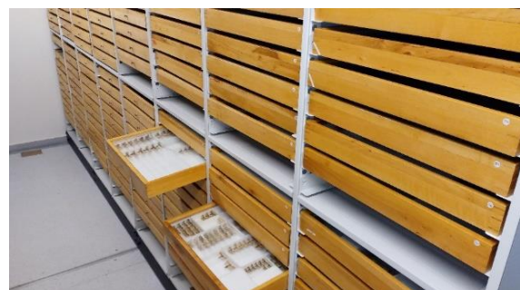
Sommerfuglsamling i magasin for naturhistorisk materiale på Lands museum.

I Kulturdepartementets tilskuddsbrev til museum for 2018 er et av målene for bevilgningene til museum «(...) å legge til rette for at - museenes samlinger sikres og bevares best mulig samt gjøres tilgjengelige». Det overordnede målet for overføringene til museumsdrift formuleres slik: «Bevilgningen til museet skal bygge opp under departementets overordnede mål om å bidra til at alle kan få tilgang til kunst og kultur av høy kvalitet, å fremme kunstnerisk utvikling og fornyelse, samt å samle inn, bevare, dokumentere og formidle