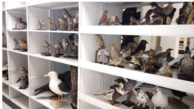
Preparater av fugl fra 1950- og 1960-tallet, fra Oppland Skogskole.

Randsfjordmuseet er eneste museum i Oppland som har ansatte med naturhistorisk fagbakgrunn, og som gjennom aktiv innsamling dekker både geologi, botanikk og zoologi. For innsamlingsvirksomheten ved naturhistorisk seksjon er det naturlig å søke samarbeid utenfor fylket, spesielt med Naturhistorisk museum (UiO), Universitetsmuseet i Bergen (UiB) og Vitenskapsmuseet i Trondheim (NTNU).