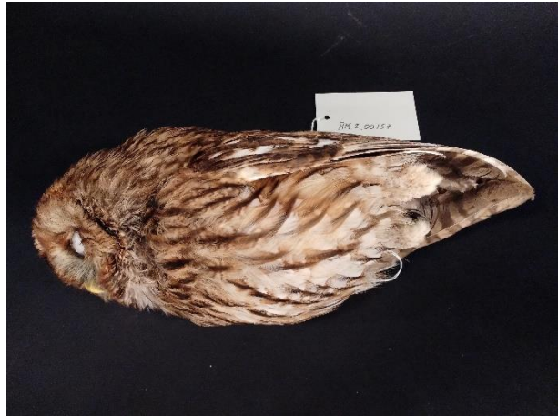
Skinnlagt kattugle fra Hadeland. Innkommet som fallvilt.

Randsfjordmuseet opprettet en stilling innen naturhistorie 2004/2005 og begynte straks etablering av en zoologisk samling. Den zoologiske samlingen ble bygget både gjennom egen innsamling og overtakelse av flere samlinger, fra både offentlig og privat hold. Et magasin for naturhistorisk materiale ble etablert på Lands Museum fra 2011, i tillegg fins tilgjengelige fryserer og fryserom. I de senere år har museet innarbeidet gode rutiner for disse samlingene.