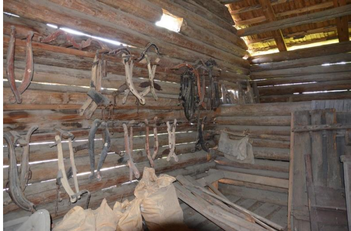
De antikvariske bygningene i friluftsmuseet brukes som lager for deler av gjenstandssamlingene. Oppbevaringsforholdene er til dels dårlige.

Situasjonen for de kulturhistoriske gjenstandssamlingene er at i underkant av 10 % er utstilt i interiørskildringer og andre monteringer, mens de resterende samlingene er magasinert eller på andre måter ikke tilgjengelig for publikum. Oppbevaringsforhold er til dels dårlige, med lav magasinkapasitet og utfordringer med hensyn til klima og skadedyr i flere av lokalitetene. Tross flere tiltak senere år, og gjennomførte allokering- og prioriteringsprosesser, er situasjonen presset. Museet har i dag ikke magasinkapasitet for større gjenstander, eksempelvis møbler, og mangel på lagringsplass vanskeliggjør ytterligere prioritering av gjenstander inn i magasin. Magasinproblematikken setter tydelige begrensninger på hva museet har mulighet til å ta inn av nytt materiale dersom ikke kapasiteten økes og eksisterende magasiner utbedres.