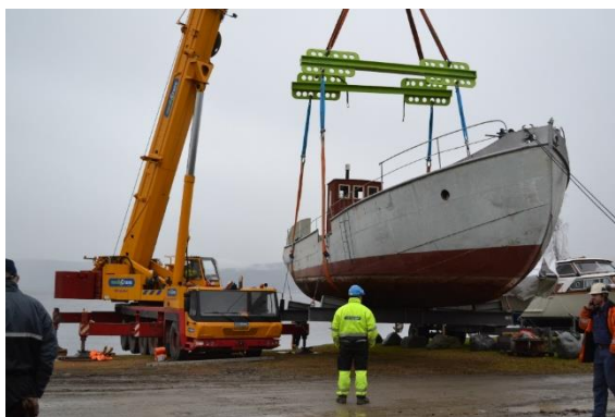
Lasteskipet M/S Brandbu settes på land i 2013.

Museet eier og/eller forvalter også enkelte tekniske kulturminner og anlegg. Dette er større objekter som i stor grad er krevende når det kommer til samlingsforvaltning. Objekter som inngår i denne samlingskategorien er sinkgruvene på Nyseter (forvaltes), lasteskipet M/S Brandbu (eies), deler av fløtningsanlegget etter Østre Bjoneelvans Fellesfløtningsforening (forvaltes) og bygdemølla Molstadkvern mølle (forvaltes).