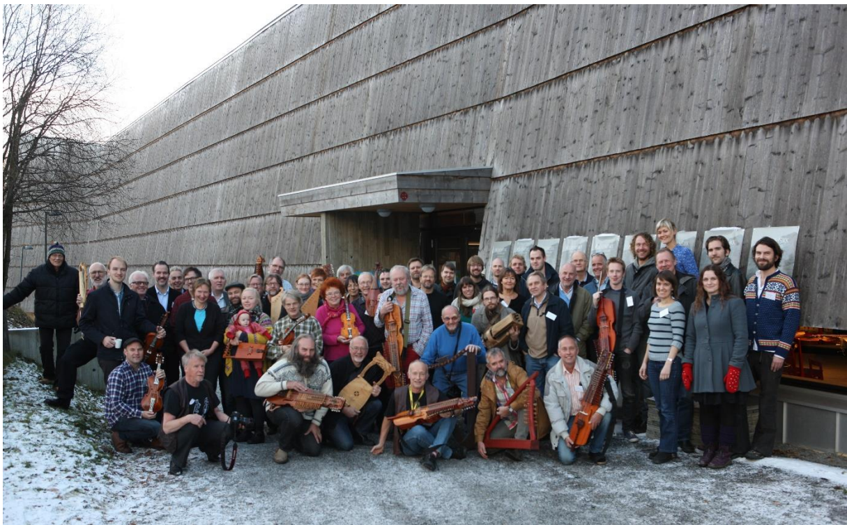
Nordisk instrumentseminar på Fagernes i 2013.

I Noreg er det Norsk kulturråd som har fått i oppdrag å legge strategiar og for dette arbeidet. I Sverige er det Institut för språk och folkminnen som skal gjere det same.