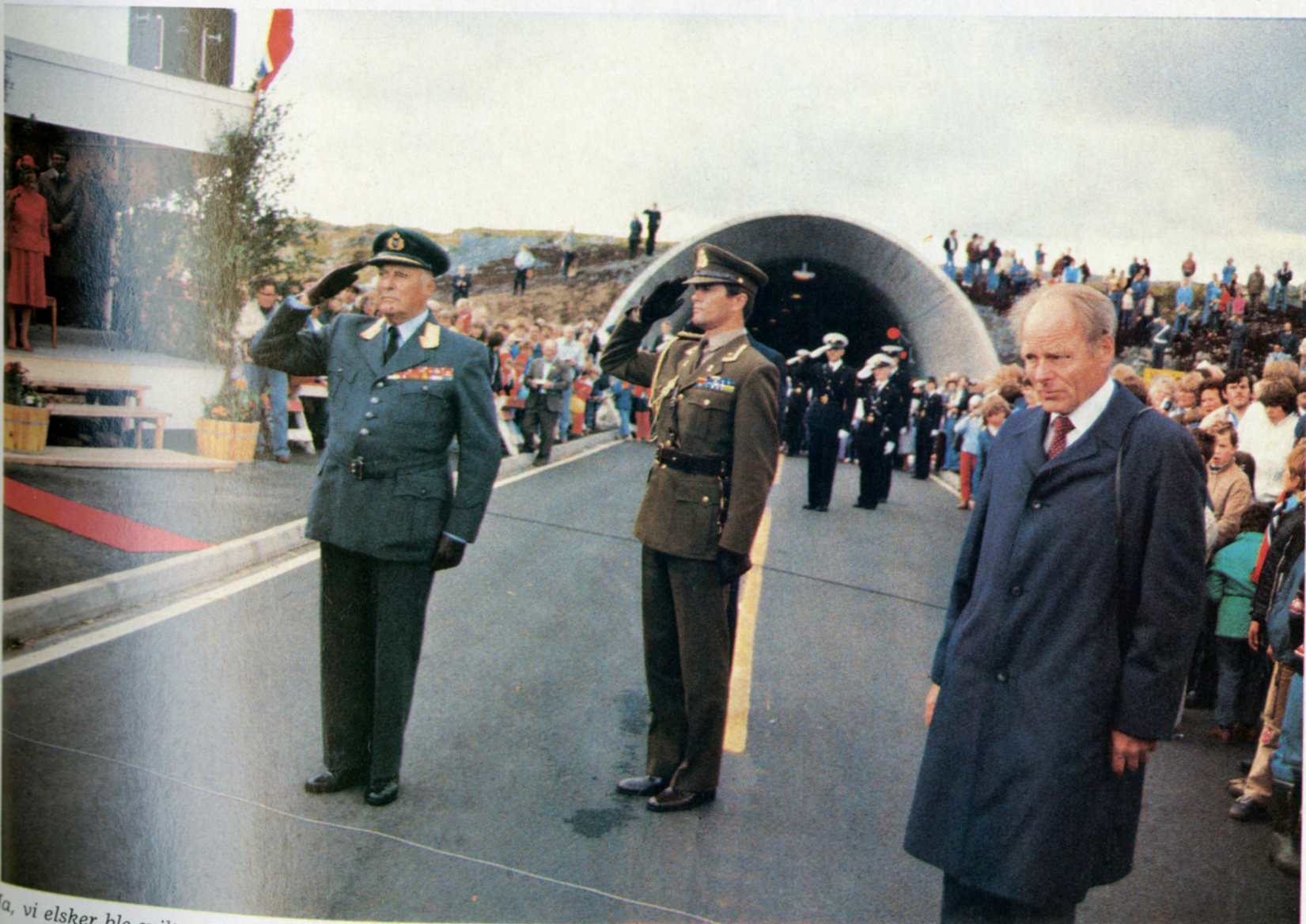
Ja, vi elsker ble spilt etter åpningen.