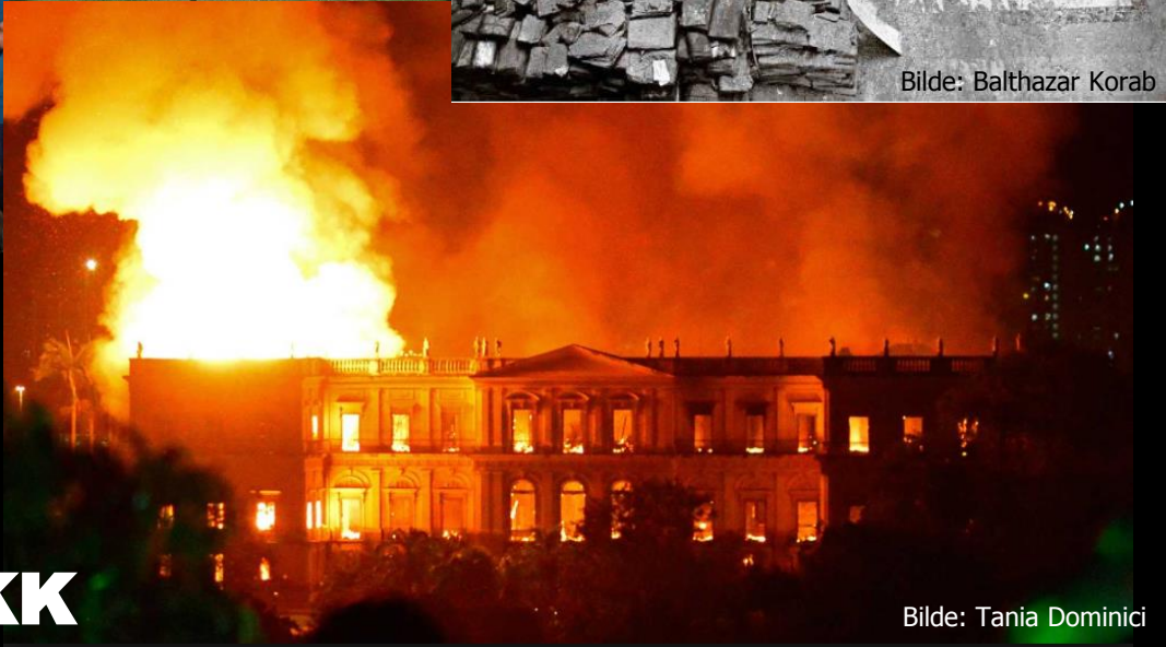
Bilde: Tania Dominici