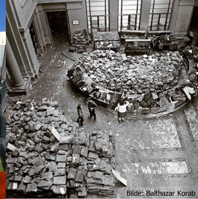
Bilde: Balthazar Korab