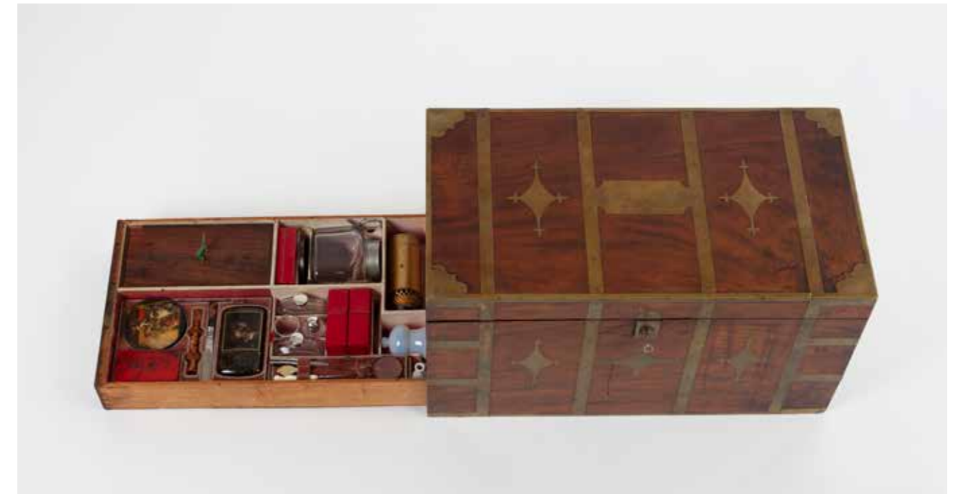
Statsminister Dues innholdsrike reiseskrin fra ca 1840 ble gitt i gave til museet i 1982. Skrinet inneholdt nær sagt alt en mann trengte på sine reiser. Det vises i utstillingen TIDSRØM.

Venneforeningen bidro i 1982 med økonomisk støtte til kjøp av et innholdsrikt reiseskrin, som hadde tilhørt statsminister Frederik Due. Skrinets innhold og sinnrike mekanismer fasinerte et moderne menneske. Samtidig gir det et innblikk i en dannelsesmanns behov og interesser på Dues tid. Skrinet skal stilles ut i den store utstillingen TIDSRØM, som løfter frem borgerskap og embetsmenn i perioden 1600-1914.