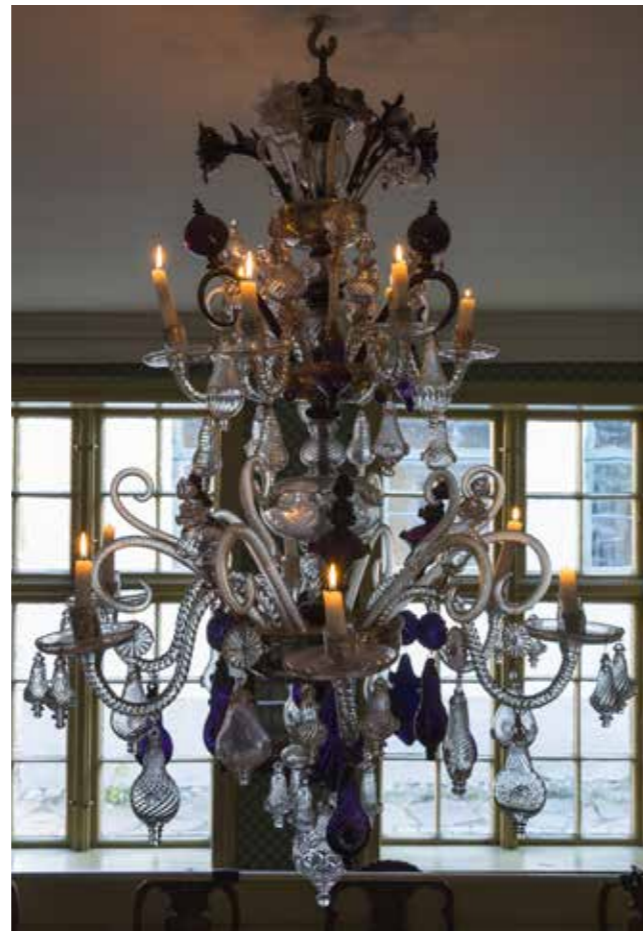
Lysekronen fra Nøstetangen glassverk fra slutten av 1700-tallet ble gitt i gave i 1977. Lysekronen vises i utstillingen TIDSRØM.

Lysekronen fra Nøstetangen som venneforeningen forærte museet i 1977, var en kjærkommen gave. Den kom fra Bredo Berntsens store glassamling som ble solgt på auksjon i 1938.