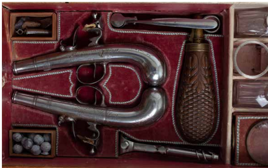
Selv om det var forbudt å duellere, inneholdt Dues skrin et sett duellpistoler, noe som forteller at duell en gang var ansett som en akseptabel måte å løse konflikter på.

et stort fortrinn i kontakten med den fransktalende nye svenske tronfølgeren og hans familie. Forbindelsen med kongehuset ble starten på en rask karriere. Due ble premierløytnant i 1818, kaptein i 1819 og major i 1822. Dues flotte utseende, gode franskkunnskaper og milde vesen tiltrakk kong Carl Johan, som i 1823 utnevnte Due til norsk statssekretær i Stockholm, det vil si sjef for den norske statsrådsavdelingens sekretariat. Bare 27 år gammel satt han nå i et embete der han også var den fransktalende kong Carl Johans tolk i statsrådsmøtene. I tillegg fremla han for kongen alle norske saker på fransk før møtene. Due ble aldri kritisert for å ha utnyttet sin posisjon og tette forhold til kongen. Den diplomatiske Due hadde en beroligende virkning på den temperamentsfulle Carl Johan, slik at han kunne unngå kriser som ellers kunne ha oppstått mellom kongen og hans norske regjering.