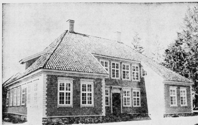
Gul og venlig, med paneler i en slags empire, — slik ser Crysste-gården ut eksteriørmessig. Den offisielle åpning finner sted 16. mai.

Tekst: Anne Mai Refnesen