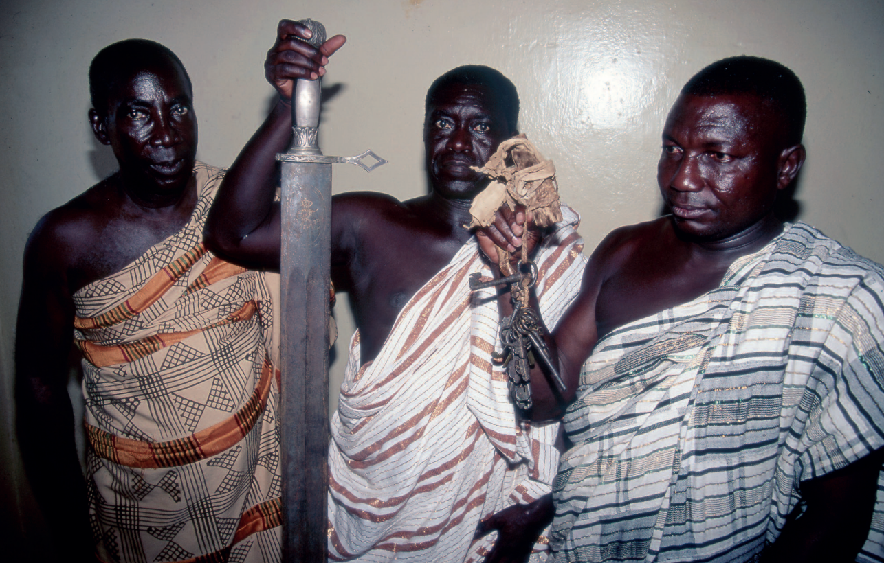
Figur 11. Nøklene til Christiansborg beholdt Akwamuene som minne etter den gang de jaget danskene ut av deres hovedført, og hadde et kortvarig opphold der. Æressverdet er en senere alliansegave fra kong Fredrik VI i 1826.