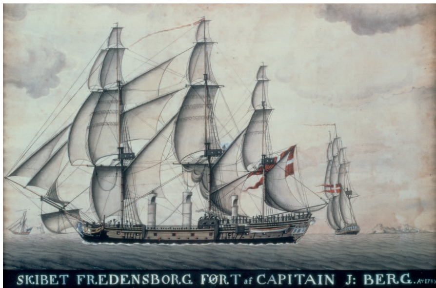
Figur 2. Fredensborg II, bygget noen få år etter forliset til Fredensborg I, men med alle slaveskipets kjennetegn. I forkant av stormasta vindfangere til å ventilere lasterommet til mannslavene. Der er også to forskansninger mot slaveopprør. Kvinneslavene holdt til i akterskipet og hadde i motsetning til mennene eget avtrede. Her i forkant av storbåten.

På initiativ fra Norsk Sjøfartsmuseum (nå Norsk Maritimt Museum) ble det i siste halvdel av 1990-årene utviklet et formidlingsprogram i samarbeid med Leif Svalesen og Aust-Agder-Museet, den norske UNESCO-kommisjonen, J. W. Cappelens Forlag og flere andre organisasjoner og enkeltpersoner i inn- og utland. Gjennom bokverk på norsk, dansk, engelsk og italiensk, og utstillinger på tre kontinenter, samt fagfellesskap og pedagogiske program, har dette formidlingsprogrammet hatt et ikke ubetydelig internasjonalt nedslagsfelt. Det siste har vært mulig ikke minst takket være at prosjektet også har inngått i UNESCO sitt internasjonale Slave Route Project. For mer omfattende innføring vises til en lengre redegjø-