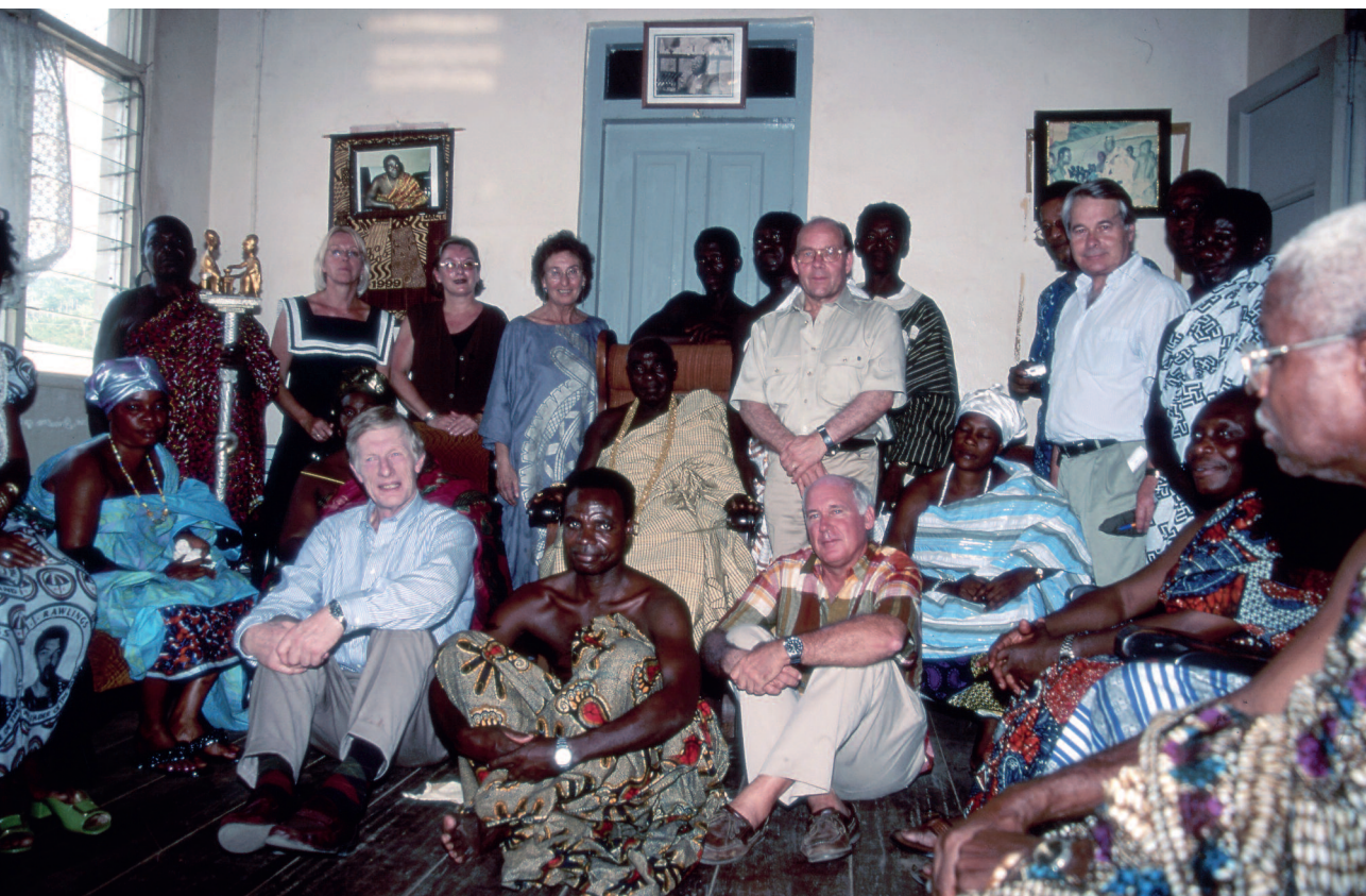
Figur 10. Medlemmer av Fredensborggruppen i audiens hos folkegruppen Akwamu. De hadde selv forfedre som hadde blitt fraktet som slaver på Fredensborg.

Før vandretutstillingen ble permanent plassert ved Aust-Agder-Museet, hadde den hatt over 200 000 besøkende. Det kan også nevnes at skole-tjenesten ved samme museum allerede de to første måneder etter åpningen