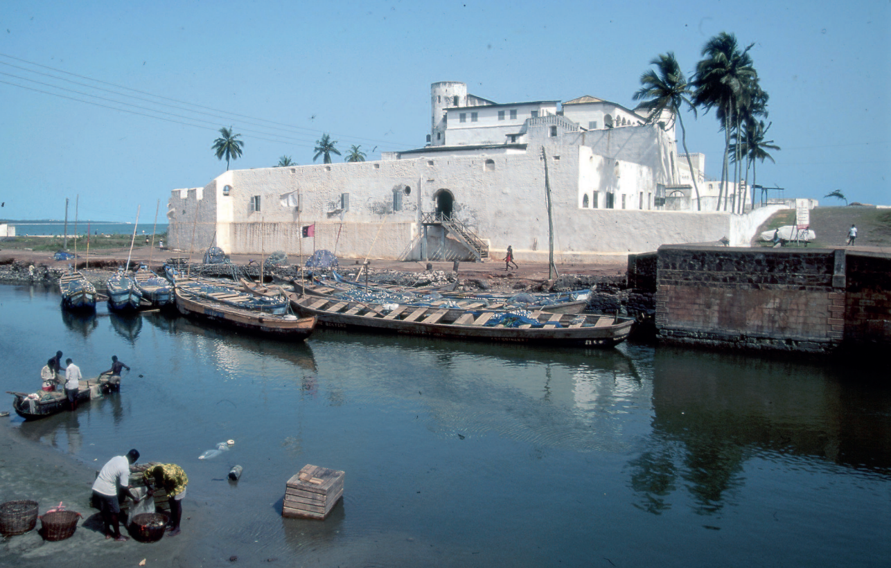
Figur 12. Elmina («Gruven») ble etablert allerede i 1482 og var portugisernes og europeernes eldste bosetning på denne del av Vest-Afrikakysten. Håp om gullforekomster lokket den gang. Navnet på denne kolonien kan ha bidratt til betegnelsen Gullkysten. Senere ble eksporten av slaver til bomulls- og sukkerplantasjene i europeernes besittelser i Amerika hovedsaken. De store strandingskanoene vitner om en kyst så å si uten naturlige havner.

Den veier 130 kg, og bærer inskripsjonen Soli Deo Gloria . Fredensborggruppen fikk støpt kopi som ble brakt over til St. Croix. Den henger nå på den tidligere Schimmelmansske plantasjonen La Grange hvor opprøret som førte til emansipasjonen fant sted i 1848, og hvor klokken spilte en sentral rolle.