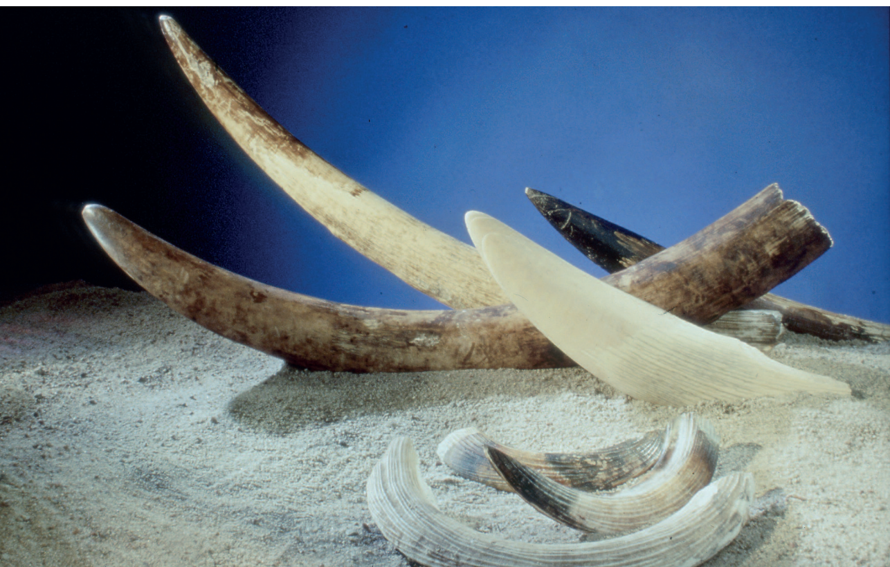
Figur 4. Noen av de mange elefant- og flodhesttenner som ble tatt opp fra sjøbunnen, her som del av vandreutstillingen om Fredensborg og triangelfarten.