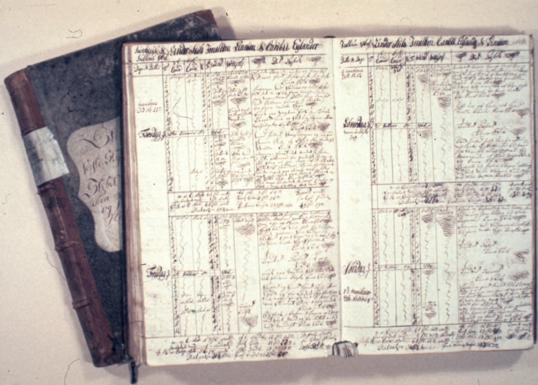
Figur 5. Bevarte skipsjournaler og andre dokumenter gjorde det mulig å følge hendelser under tilnærmet hele triangelveien.

Det ble videre utarbeidet to mindre utstillinger som ble montert henholdsvis ved Fort Fredrik Museum i Fredriksted på St. Croix og ved The National Museum i hovedstaden Accra i Ghana. I områder nær Accra ble det også satt opp en del informasjonsskilt med opplysninger om dansk-norske kulturminner. I tillegg til dette ble det sørget for å lage kopi av den store malmklokken som hadde hengt på den Schimmelmanske plantasjonen La Grange på St. Croix i Karibia. Klokken ble bl.a. benyttet under det store slaveopprøret der 3. juli 1848. I juli 1768 ble 18 afrikanere av Fredensborgs slavelast på 265 personer solgt til denne plantasjonen. Utstillinger og skiltprogram ble utført på Norsk Sjøfartsmuseum.