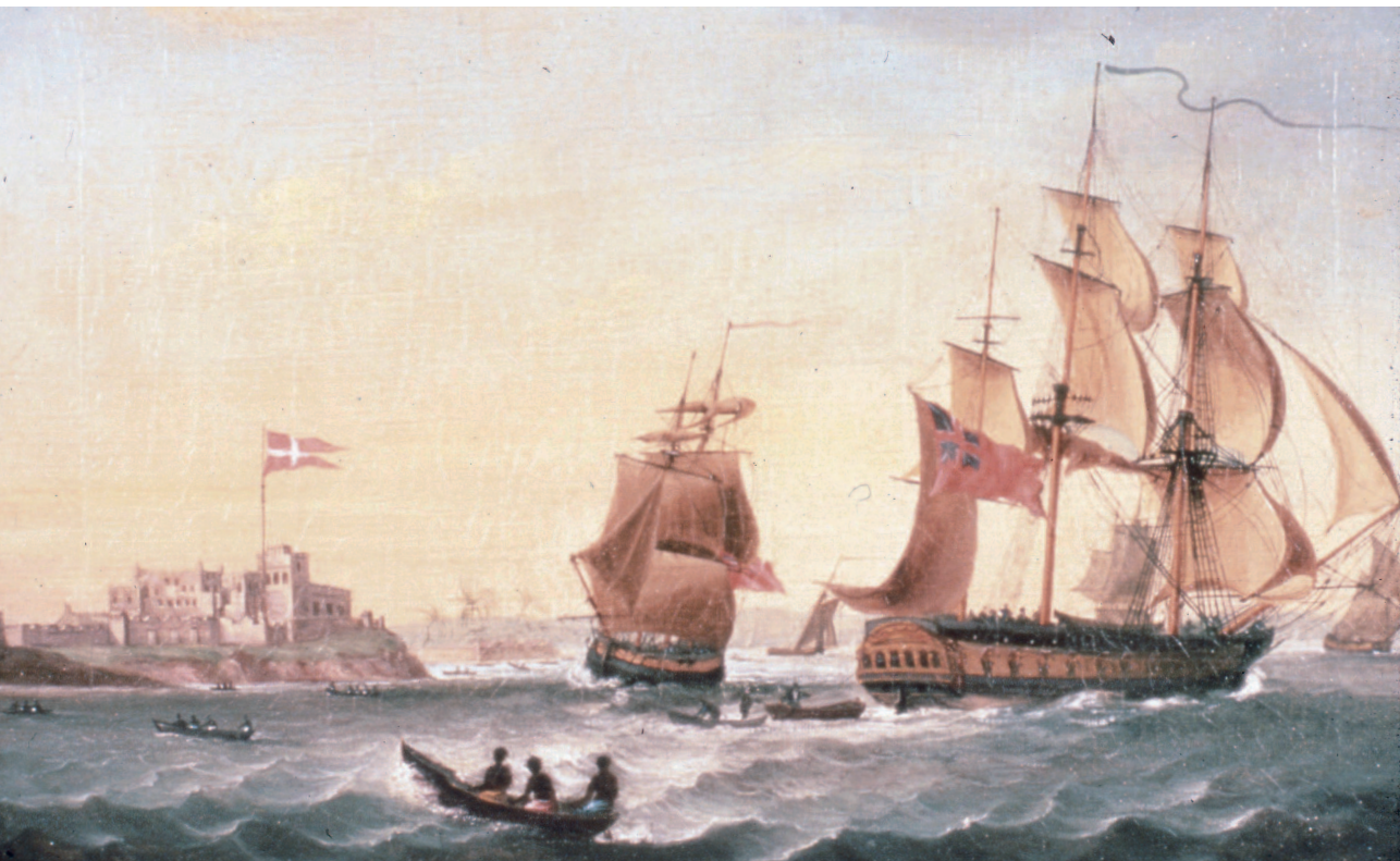
Figur 6. Danskene hadde 3 forrt og i tillegg 2 handelstasjoner på Vest-Afrikakysten. Fredensborg ankret opp utenfor hovedfortet Christiansborg 1. oktober 1767, og seilte videre mot St. Croix kl. 1200 -23. april 1768.

Hele prosjektet har hatt sitt naturlige utgangspunkt i funnet av slaveskipet Fredensborg utenfor Tromøy ved Arendal i 1974. Men uten UNESCOs bidrag og den utstrakte bokproduksjonen ville nok dette skipsfunnet ha fått en vesentlig mer anonym rolle. Årsaken til interessen for å benytte slaveskipet Fredensborg i de mange ulike sammenhenger, har vært muligheten for å knytte den overordnede historien om triangelfarten til et konkret skipsfunn og en vel dokumentert reise, og videre å gjøre denne historien relevant i UNESCOs mer overordnede arbeid.