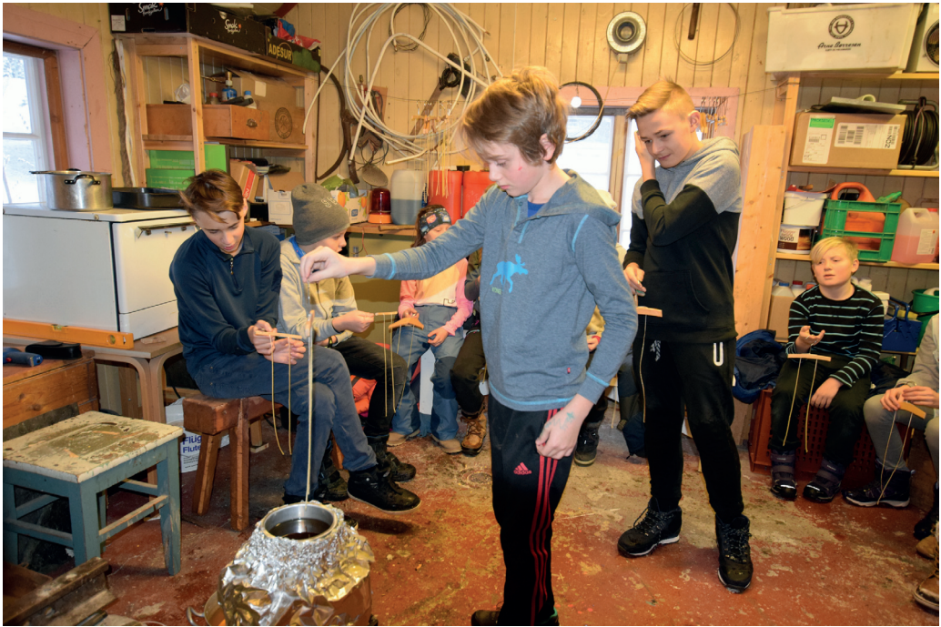
Lysstøping. Under juleverkstedet fikk ungene prøve seg på lysstøping etter gammel metode.