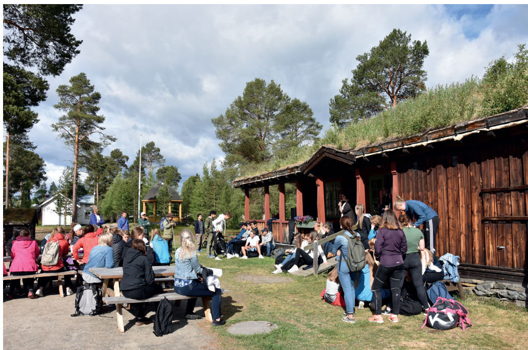
Museumsparken. Elever fra Nord-Østerdal VGS fikk et rikholdig program i Museumsparken på Tynset.