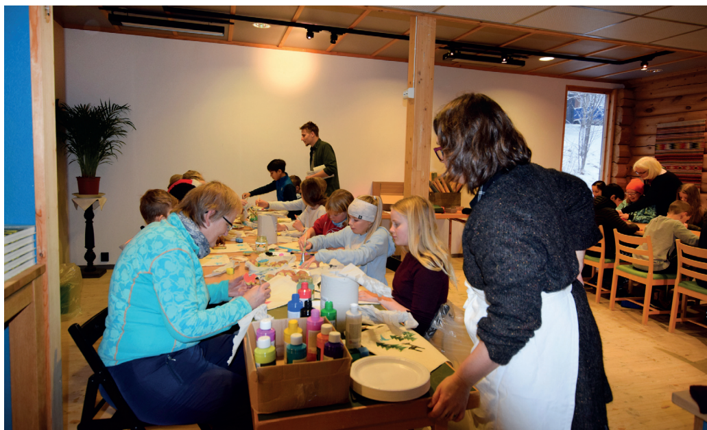
Juleverksted. Det myldret av barn på juleverkstedet på Ramsmoen, og alle fikk lage julegaver.