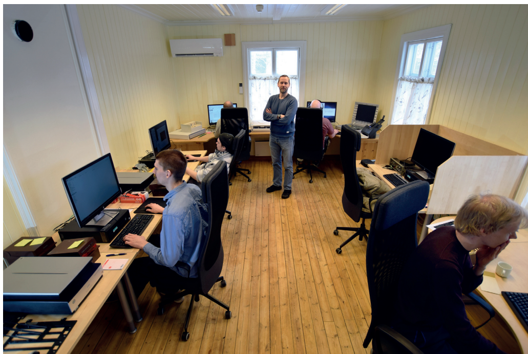
Digitaliseringsenheten. Gammelstua på Ramsmoen er omgjort til en digitaliseringsentral, hvor det skannes og registreres katalogkort og protokoller, samt bilder, arkiver og alt mulig annet.

datert sikringsanlegg ved det meget spesielle tunet. Søknadsskriving har kommet i gang for et større prosjekt for å restaurere det som er igjen av den gamle låven der, samt å få rekonstruert delene som er borte. Ellers bistår vi våre underavdelinger med rådgiving og en god del forebyggende vedlikehold. Mye ressurser har for øvrig gått med til flytting av vårt eksterne lager til en langt bedre og sikrere lokasjon. Det er stort behov for lagring av en del store gjenstander midlertidig, samt materialer, utsyr og maskiner.