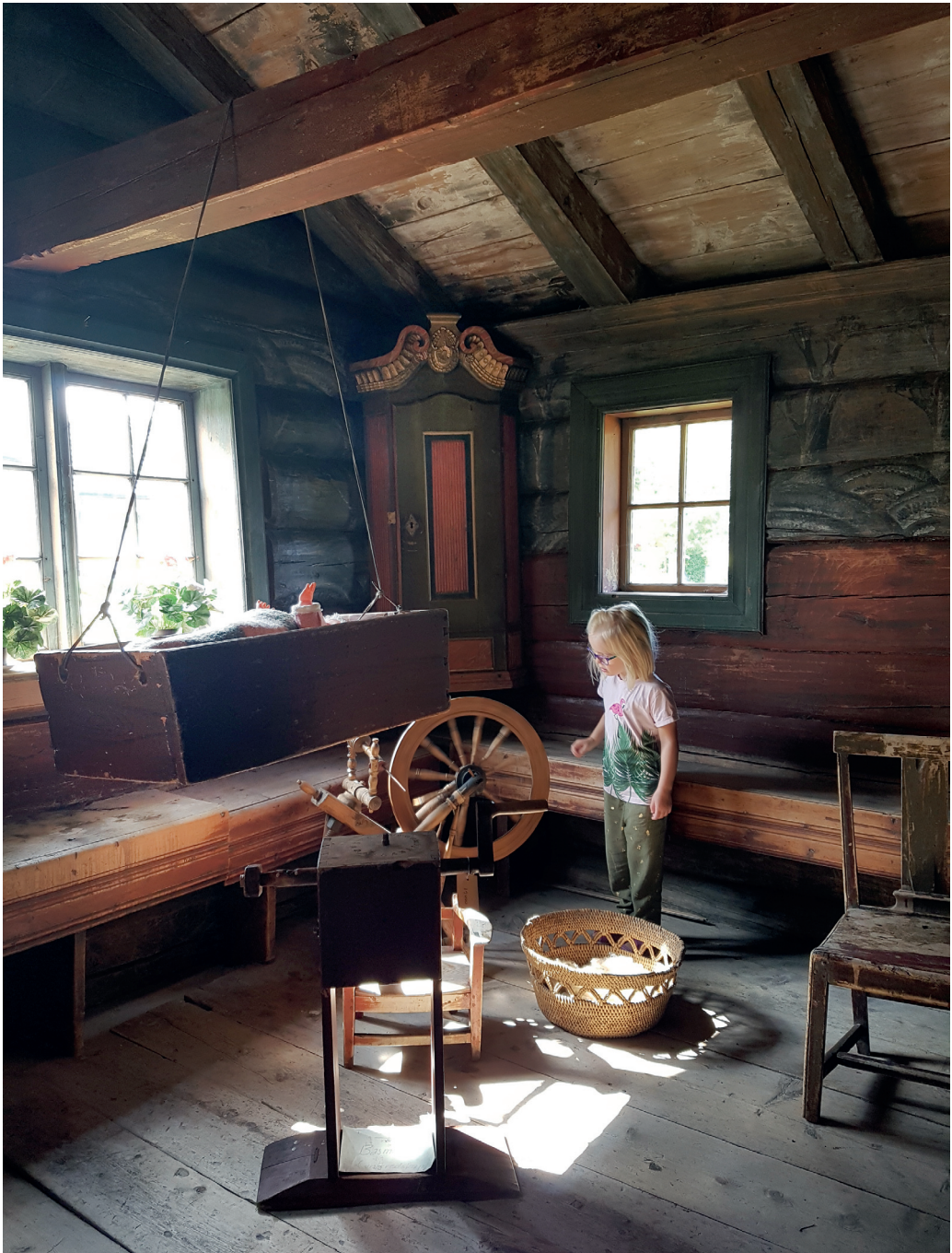
Lonåsstua. I det varme sommerværet var det godt å komme inn i den fantastiske Lonåsstua i Museumsparken på Tynset.