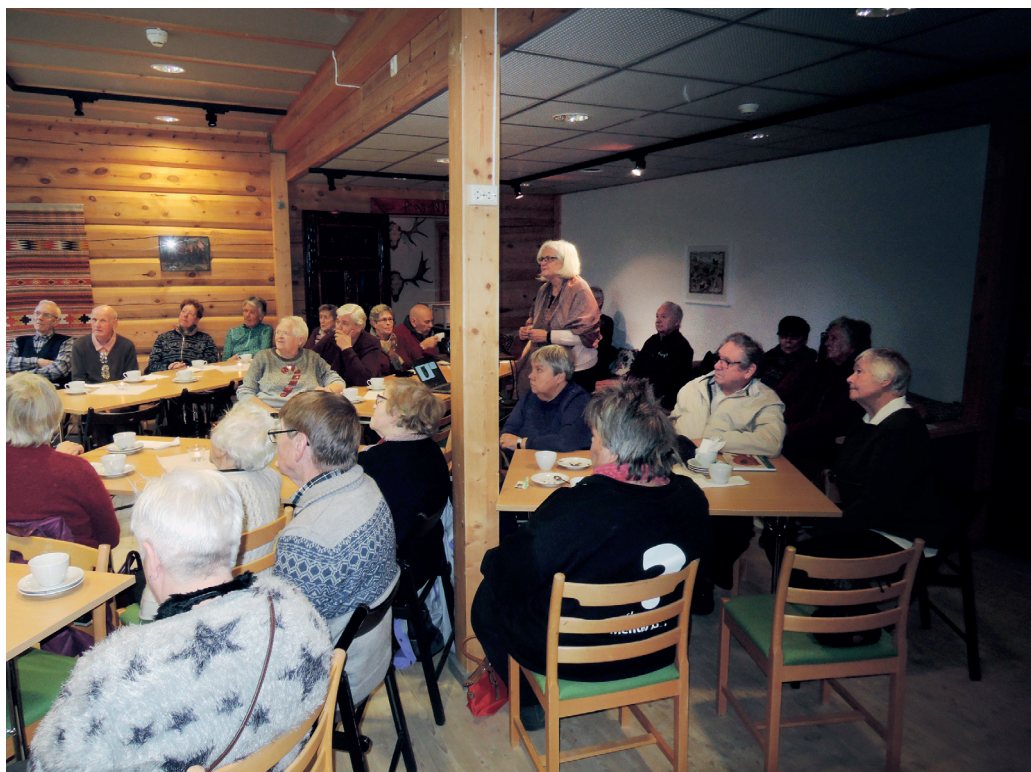
Eldrekafe. Samarbeidet mellom Anno Musea i Nord-Østerdalen og en elevbedrift ved Nord-Østerdal VGS har slått veldig godt an hos pensjonistene i regionen.

lysstøping, papirbretting og med stofftrykk. Fine julegaver ble det, og vi får god tilbakemelding i vår samhandling med skolene på både praktiske opplegg og der vi direkte er inne med formidling av kulturhistorie. Vi startet for øvrig opp så smått et prosjekt i 2018, hvor vi skal komme tettere inn på skolene i regionen og kunne være en ressurs med tanke på kulturhistoriske opplegg og å lage en struktur for hva elevene bør få med seg gjennom skoleløpet.