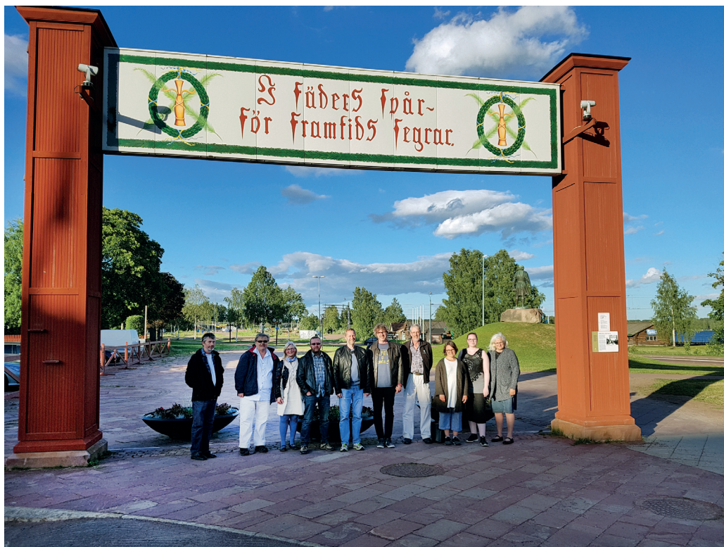
Studietur. Alle ansatte ved Anno Musea i Nord-Østerdalen dro til Dalarna for å lære og bli inspirert.