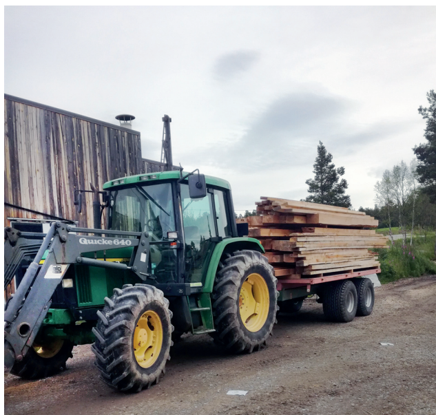
Materialer. Til god restaurering trengs det kvalitetsmaterialer, som her blir fraktet med kvalitetskjøretøy til lagring, for senere bruk.

Anno Musea i Nord-Østerdalen består av veldig mange bygdetun og anlegg med rundt 130 bygninger. Det sier seg selv at behovene er store både for restaurering og